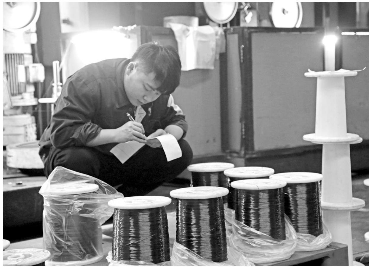
铜冠电工公司职工日前正在立式漆包机前统计当班生产数据。铜冠电工公司通过对漆包线厂立机改造满足了大规模漆包线订单的交付, 产品单位能耗由原来的每吨1200千瓦时下降到600千瓦时, 降低了能耗, 优化了生产工艺, 提高了成产率, 使闲置设备产能得以有效发挥。

本报讯 日前, 集团公司生产机动部组织专业检查组对铜山铜矿分公司2018年度设备管理工作进行综合检查考评, 全面检查该公司去年一年来设备管理工作的成果, 提升设备管理水平。 此次考核评价, 重点围绕设备管理基础工作, 5S与润滑, 设备设施固定资产管理, 特种设备管理, 设备管理计划、使用与维修及监督与考核, 内部对标等方面进行系统评价, 分析存在的突出问题和薄弱环节。此外还肯定了该公司在加强设备精细化管理, 加大进口装备及备品备件国产化改造或替代, 推进全优润滑技术的应用和持续开展修旧利废及设备降本增效方面一些好的做法和亮点。 张震 阮宏伟