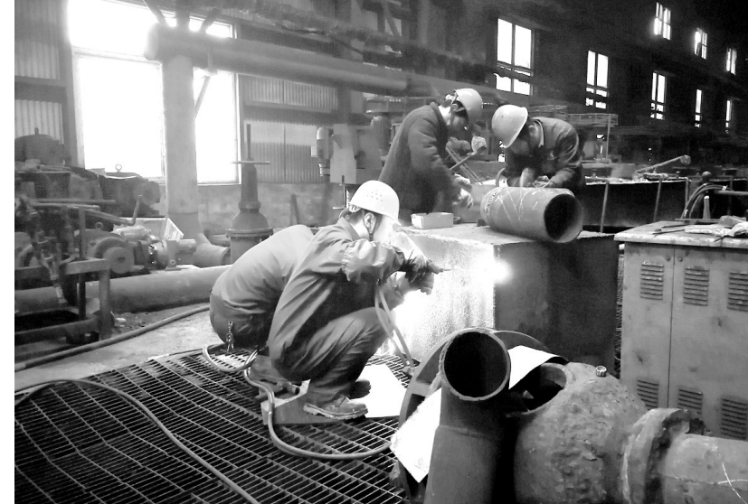
日前, 天马山矿业公司选金车间磨浮维修班正在制作砂箱, 对内部循环水系统进行改造, 提高循环水利用率。该公司鼓励广大职工对设备、工艺、操作等方面大力开展小发明、小创造、小革新, 实现降成本、增效益。