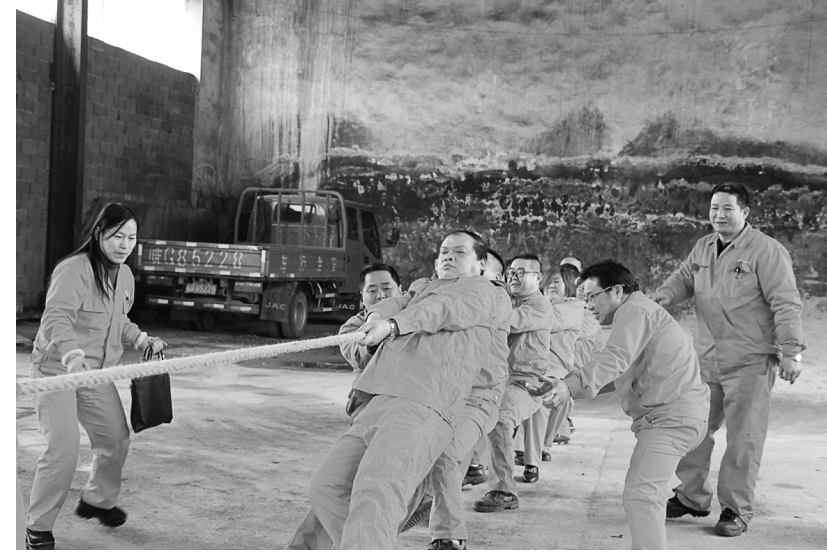
农历正月十五, 元宵佳节, 拔河、“攒蛋”等形式多样、内容有趣的“迎新春”系列文体活动持续在工程技术分公司上演。拔河比赛率先开场, 经过几轮激烈的角逐, 该公司事业一部代表队获得了冠军。