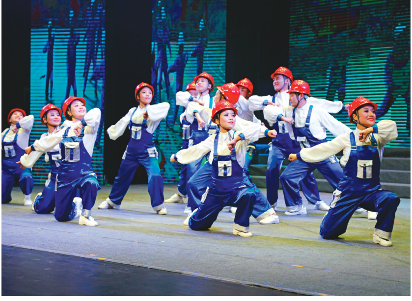
金隆铜业公司职工正在表演说唱剧《安环助咱乐生活》。