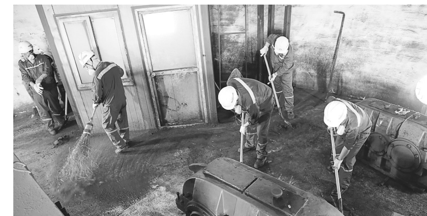
金隆铜业公司加强共产党员的奉献教育意识,要求党员时刻牢记自己的身份,处处当先锋,时时讲奉献。公司各党支部每月都利用党员活动日等组织党员开展义务奉献,发挥一名党员一面旗帜的示范引领作用。图为该公司渣渣党支部党员正在进行生产现场环境整治义务劳动。 章庆陶 洪巍

积极改善员工学习环境,营造良好的“学习型企业”氛围,从技术人员到作业现场,从计生小组到质量小组,每周均有一定的学习安排,并取得良好成效。 江君 汪文萍