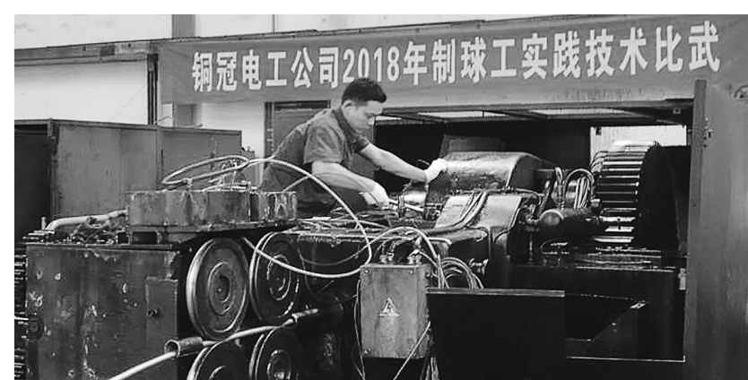
为大力弘扬工匠精神,提高全员业务技能,连日来,铜冠电公司广泛开展系列员工技术比武活动,涉及铜杆拉丝、制球和检验等铜加工关键岗位共3大工种,约120多名生产一线员工参加了比赛。活动以“比理论、比技能、看业绩”的方式进行,分为岗位练兵、理论考试、实操考试三个阶段。