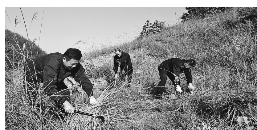
10月24日,铜山铜矿分公司保卫部经济护卫人员在清除矿山重点防火区域周围的杂草。针对秋季天气干燥,火灾隐患增多,该公司强化对重点区域的隐患排查,及时消除隐患,做到防患于未然。 张霞 任建中