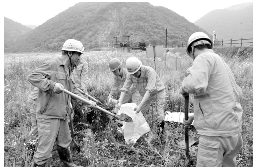
6月8日上午,凤凰山矿业公司消防防汛应急演练在该公司相思谷尾矿库开展。此次防汛演练是对该公司安全生产应急指挥能力、现场抢救、医疗救援、协同配合、应急处理能力等的一次实战检验。通过开展应急演练,提高了公众风险防范意识和自救互救等灾害应对能力。