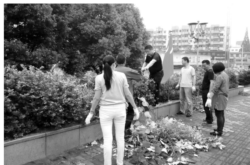
6月8日,铜冠地产公司商业广场党支部组织党员,对商场周边环境进行整治。他们冒雨清理清除绿化带杂草、垃圾,营造良好的招商环境。