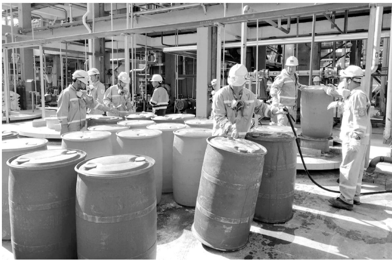
近日,金冠铜业分公司奥炉硫酸车间全体党员聚集在环集吸收塔下,组织开展以“节约从点滴做起”为主题的党员义务奉献活动。针对使用完的400桶离子液料桶中,仍残留少许离子液结晶体现象,组织党员开展了收集点滴残留离子液现场。