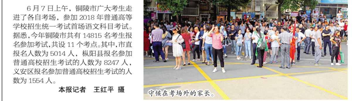
守候在考场外的家长。