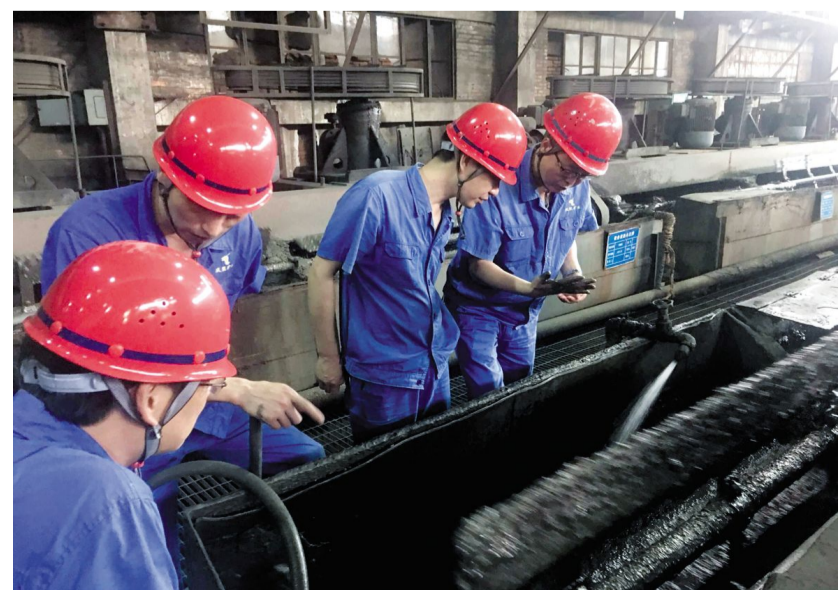
日前,凤凰山矿业公司选矿车间开展安全大检查(如图)。重点对作业现场的安全措施是否到位以及安全操作规程和安全要求的执行情况,是否有“三违”现象,生产现场及厂房周边环境的文明卫生落实情况等进行检查。