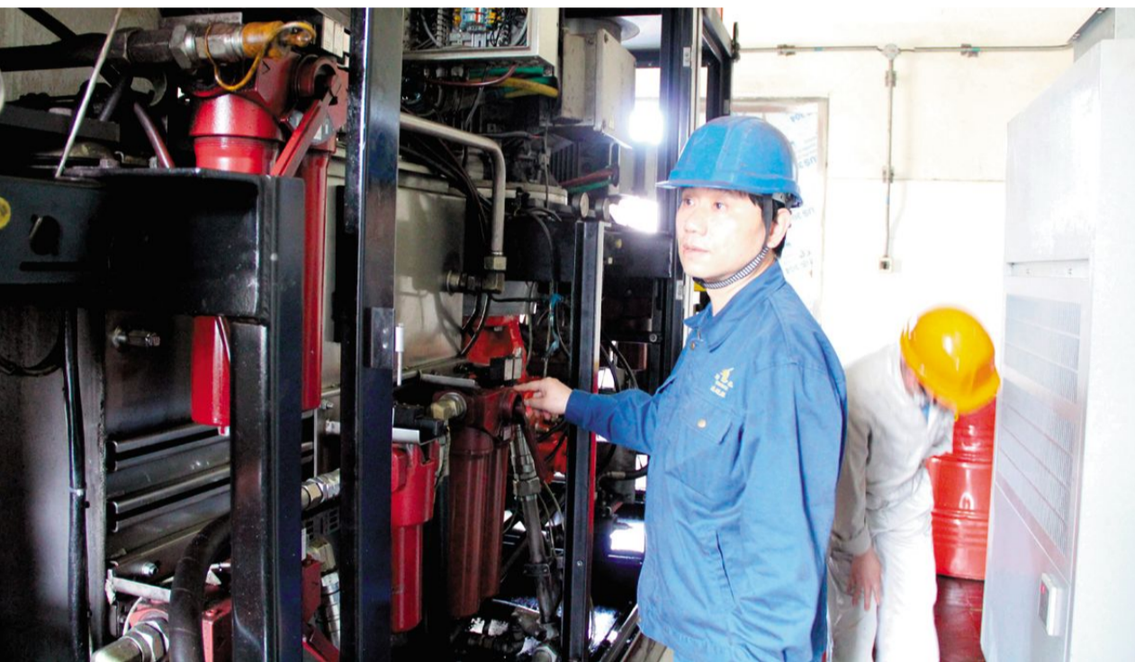
铜冠冶化分公司为进一步提高设备管理水平,强化设备日常管理,充分发挥点检员的作用,对A、B类设备进行点巡检,对运转设备通过一听、二看、三手摸,及时掌握设备运行状态,确保设备运行安全。图为点检员正在对回转窑动力站进行点检。

深入学习贯彻落实十九大精神专题等栏目,并链接中央、省、市等党建网。旨在围绕全矿党建工作,传播党建工作重大决策部署,重点推送党建要闻、基层党建、党规党纪、先进典型、热点问题等,让广大党员干部从另一个视角了解全矿党建工作,实现党建工作信息化,传播党建好声音和正能量。这个矿党委高度重视新媒体的传播,鼓励党员干部积极为“冬瓜山铜矿党建网”“冬矿党建公众号”平台建设献计献策,以文