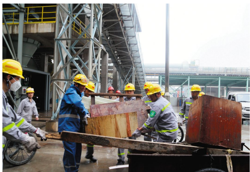
5月12日,在金冠铜业分公司奥炉精炼车间转炉余热锅炉球型烟道的下方,该公司党委委员及奥炉厂党支部书记们,对该区域乱摆放的废旧铁块等物进行分类整理回收(如图),并将该区域地面的建筑垃圾进行全面清扫。

本报讯 5月14日,铜冠地产公司在安工学院举办物业管理培训,对来自黄狮渡金矿的51名劳务输出人员进行为期两个月的岗前培训,7月中旬开始,他们将走上地产公司的维修、园林绿化、养殖、保洁、保安等物业管理岗位。黄狮渡金矿关停后,集团公司统筹大局,先后将黄狮渡金矿的富余人员劳务输出至铜冠矿建、铜冠地产等二级单位。该公司利用所属子公司昌徽公司这一平台,吸收合并吉安物业公司,将房地产营销代理、物资采购和物业管理等业务全部归入昌徽。为提供更多的岗位,该公司在做好传统物业基础上,开展了“大物业”经营,经营范围涉及建材、设备及其他物资的购销业务,房屋销售代理、中介服务,商业物业招商运营业务,社区文化服务、特约服务等业务以及搬家、家政服务等各种生活服务业务。该公司还将逐步通过招投标方式取得学校、商场、政府大楼、体育场馆、专业停车场等业态的物业管理服务,降低小区物业管理所占比重。在开展多样化经营,丰富经营业态的同时,考虑到物业工作的持续性,该公司计划分两批次清退外聘人员,以腾出更多岗位来安置集团公司富余人员。4月,该公司上报了岗位需求计划,对岗位类别、需求人数、工作地点、需求条件、工作内容和支付的劳务费用标准都做出了详细描述。最终,56名富余人员报名参加。该公司人力资源部副主任赵文亮向记者介绍,铜冠地产计划通过接收黄狮渡金矿劳务的形式,分两批对其进行安置,并进行岗前培训。培训采用军训和专业知识介绍两种形式,旨在让劳务输出人员尽快掌握维修、绿化等专业外知识外,也能培养团队意识和吃苦耐劳精神。待劳务输入人员上岗后,铜冠地产将根据安置人员的工作情况进行考核,并实施末位淘汰。每月,该公司将劳务人员的薪酬按照约定标准支付给劳务派出单位,由劳务派出单位发放薪酬,并拿出实发工资的25%-30%进行考核,将考核结果提供给劳务派出单位,由其根据考核结果发放工资。严格考核实施末位淘汰。对外派出去的人员进行月度考核和年度考核,不称职的员工淘汰回原单位。该公司负责人表示,对物业管理业务的整合和提升,是在妥善安置集团公司的富余人员的同时,充分发挥他们的能动性,并通过内部资源的优化整合,改善整个物业管理业务的运营机制,达到增收增效的目标。陈潇 陶敏