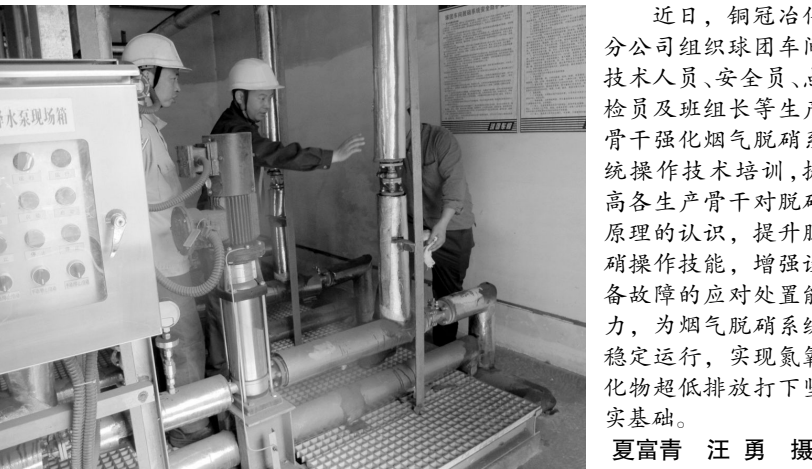
近日,铜冠冶化分公司组织球团车间技术人员、安全员、点检员及班组长等生产骨干强化烟气脱硝系统操作技术培训,提高各生产骨干对脱硝原理的认识,提升脱硝操作技能,增强设备故障的应对处置能力,为烟气脱硝系统稳定运行,实现氮氧化物超低排放打下坚实基础。