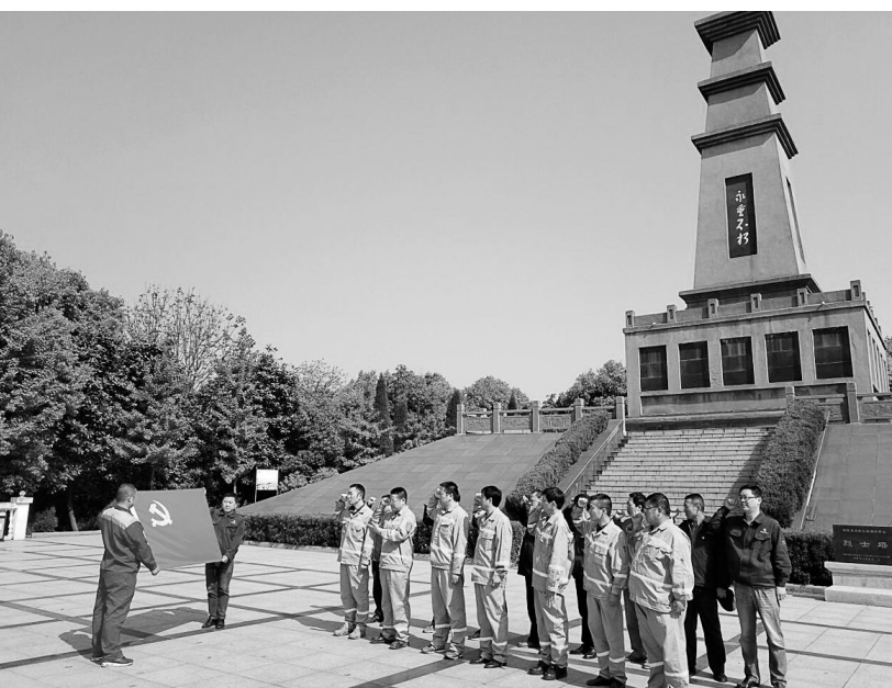
铜冠铜业分公司新技术党支部日前组织全体党员在笠帽山烈士陵园开展“缅怀先烈,重温入党誓词”活动。该党支部通过组织党员开展重温入党誓词活动,让党员重温入党誓词时的庄严承诺和坚定决心,在生产工作中更好地发挥共产党员的先锋模范作用。

是本届大学生科技文化节首场专题报告。该院邀请中科大计算机科学与技术学院陈凯明教授为大家作题为《互联网+》的专题报告。据悉,该院大学生科技文化节自2007年举办至今,历经十年岁月,始终致力于学院人才培养中心工作,通过整合校内外资源,将专家讲座、专业技能竞赛、文体活动等工作单元相集成,采用举办科技文化节的形式系统实施,以激发大学生们的专业学习兴趣,营造浓厚的校园文化氛围。 陈潇 徐婧婧