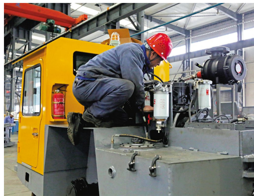
铜冠机械公司无轨分厂职工日前正在装配新产品静液压服务车。铜冠机械公司无轨分厂为不断扩大无轨产品覆盖范围,持续开展新产品研发工作。他们于去年新研发的首台静液压服务车已取得了重要进展,目前组装已进入尾声,即将开始整车测试。