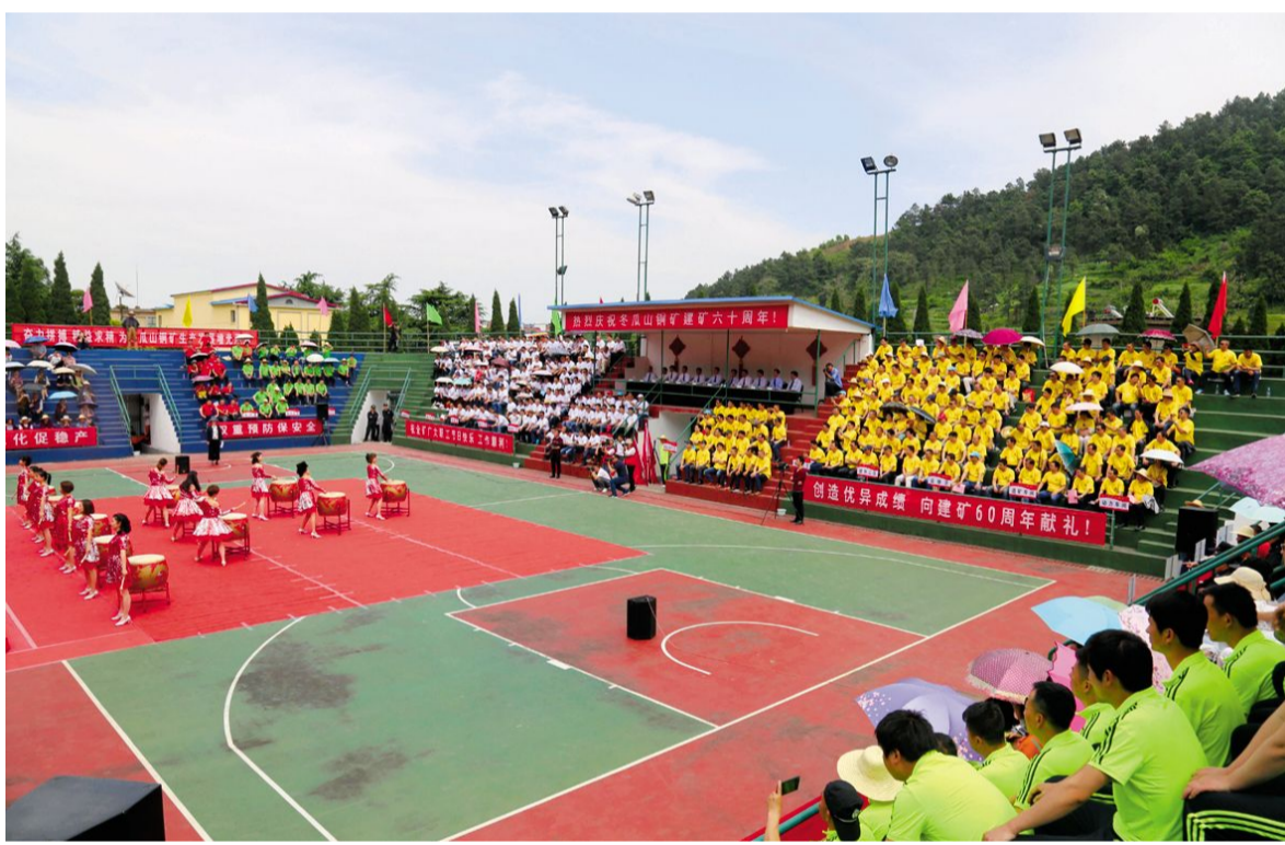
4月20日下午,冬瓜山铜矿文体中心热闹非凡,该矿近千名职工欢聚一堂,喜庆建矿60周年暨28个矿工节。60年来,冬瓜山铜矿在开发矿业的征程中,谱写了一篇篇辉煌的创业史、发展史、光荣史。当前全矿上下奋进新时代,扬帆新征程,努力创造新时代辉煌业绩。图为职工文艺表演场景。