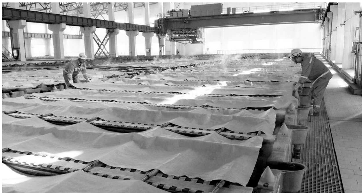
3月19日,金冠铜业分公司“奥炉”厂区电瓶车职工正在为电解槽保温作业。当日,由金冠铜业分公司“双冈”厂区倒运的第一车电解液顺利安全到达该公司“奥炉”厂区电瓶车并注入循环槽。截至到当晚23时,共完成倒液190多吨,23时20分“奥炉”厂区电解循环系统开启运行,标志着该公司“奥炉”厂区电解系统按期通电生产迈出关键的一步。

当今社会,学校重视教育固然重要,家长培养孩子爱好未尝不可,但也要因材施教,莫把孩子快乐的童年变成家长理想抱负的牺牲品。这种拔苗助长的教育不仅值得学生家长去思考,更重要的是要有一个平常心去正确对待。 夏富青