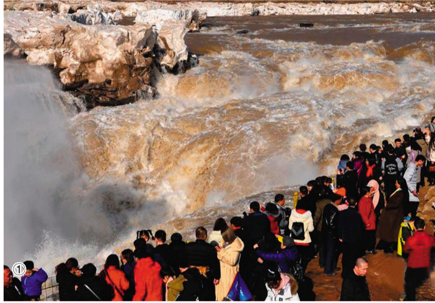
①2月21日,游客在山西省古县黄河壶口瀑布景区观光游览。