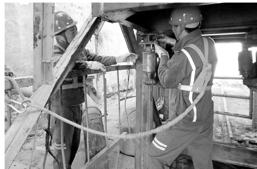
11月9日,铜山矿业公司运转区维修人员在副井口检查更换罐笼滑轮。罐笼是矿山坑下生产的安全咽喉,该公司严格执行提升系统管理技术标准,通过周检、月检和勤维护保养,确保提升系统安全。