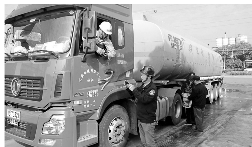
金泰化工公司强化危化品运输车辆管理,对危化品车辆的装载情况、车身标识、相关证件、应急处理器材、安全附件及其它携带物实施严格检查,对不合格项立即要求整改纠正。通过举一反三,时刻警醒运输从业人员,增强其安全意识和守法意识,切实保障企业财产安全和原料、产品运输安全。