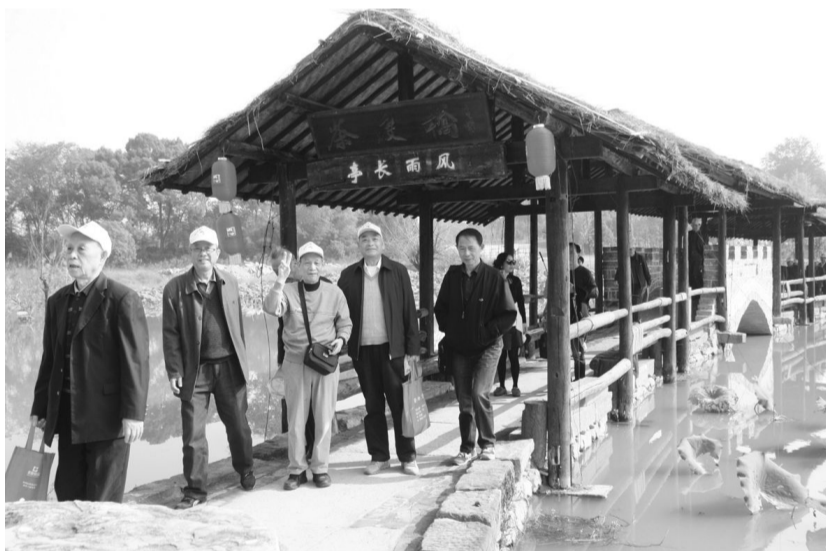
10月28日是一年一度的重阳节。为使离退休老干部过一个愉快而又有意义的节日,10月27日,集团公司老干部处和机关党委组织80多位离退休老干部到池州市杏花村文化旅游度假区参观(如图)。老干部们高兴地说:“岁岁重阳,今又重阳,新时代的老年人生活越过越阳光!”