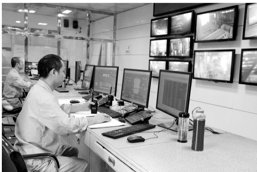
日前,铜冠冶化分公司抓住冶化生产的黄金季节,强化生产管理,精心操作,合理配料,在保生产、保质量、保安全、保设备正常运转的情况下,大干一百天,力争多干多超。图为该公司硫酸车间主控操作现场。