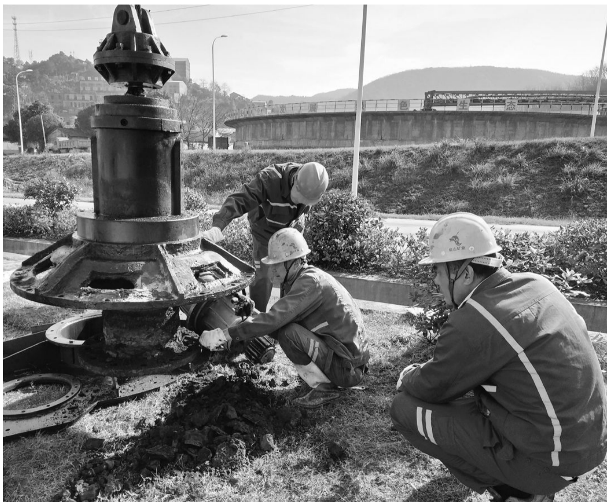
铜山矿业公司针对矿石性质粘性强,在生产过程中,铜精矿泡沫易使铜浓密机中心轴卡死而影响生产这一现象,通过增加铜浓密机中心轴的长度来避免该现象的发生,从而确保生产稳定运行。图为日前该公司选矿车间维修工正在对铜浓密机中心轴进行改造。