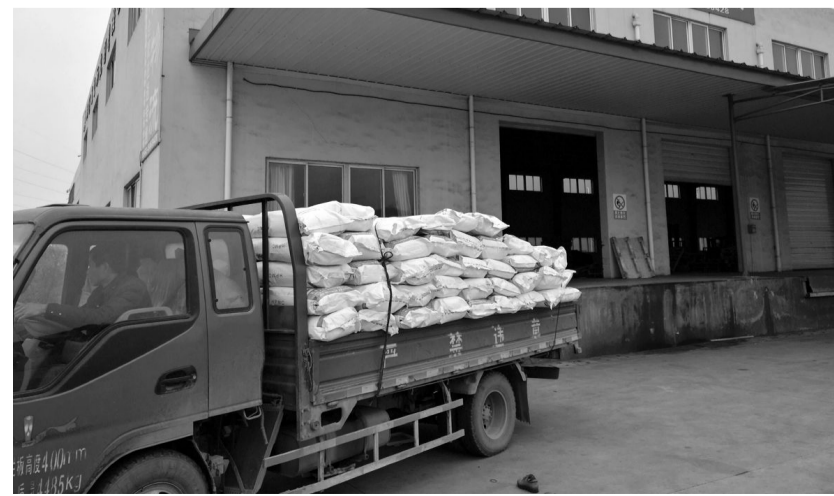
铜冠物流金运物流分公司充分发挥铜冠工业物流园区的仓储功能,积极发展物流专线业务,取得良好成效。图为进驻园区已经分拣的货物整装待发。