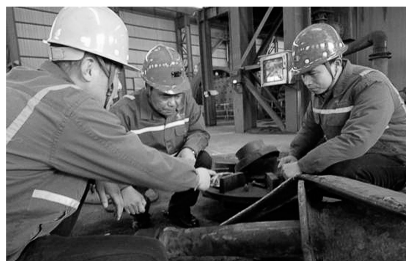
日前,铜山矿业公司行政主要领导在选矿车间寻找分析机械故障(如图)。该公司在深入开展挖潜、节能、降耗及修旧利废活动中,注重抓好生产源头工作管理,有效地推进了公司生产成本效益的考核机制朝着精细化管理目标迈进。