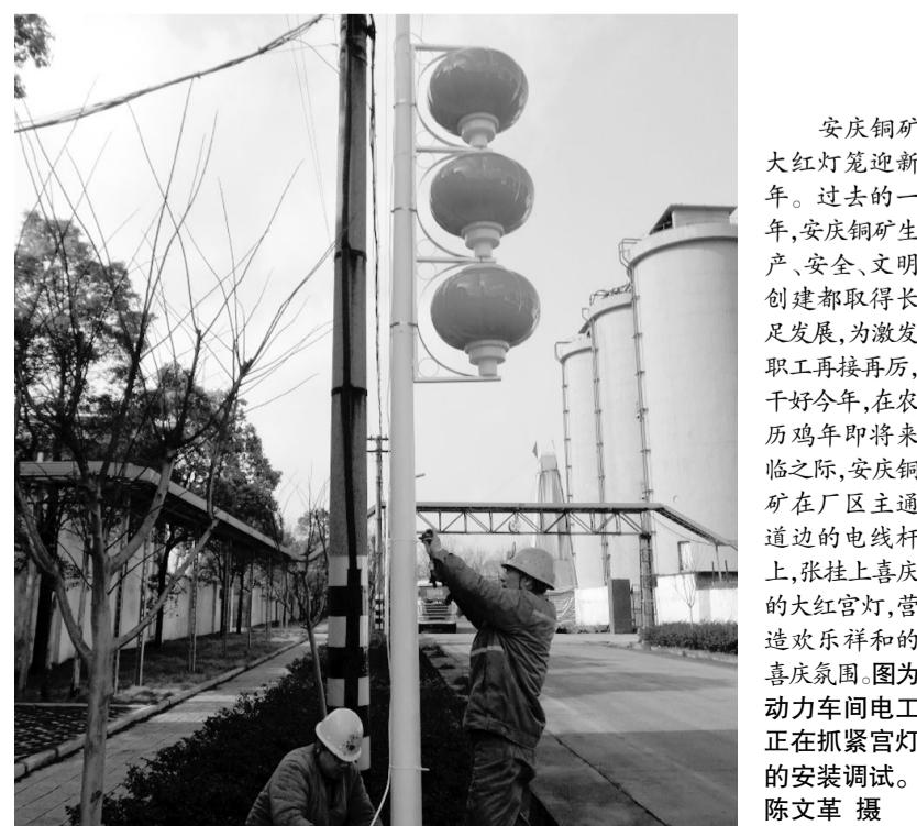
安庆铜矿大红灯笼迎新。过去的一年,安庆铜矿生产、安全、文明创建都取得长足发展,为激发职工再接再厉,干好今年,在农历鸡年即将到来之际,安庆铜矿在厂区主干道边的电线杆上,张挂上喜庆的大红灯笼,营造欢乐祥和的喜悦氛围。图为动力车间电工正在抓紧灯笼的安装调试。