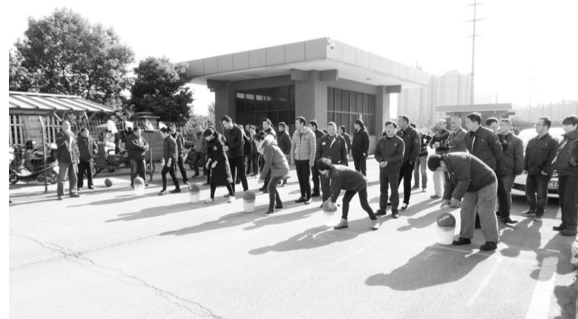
为迎接鸡年的到来,近日,铜冠电工公司举办了一场别开生面的拍篮球趣味接力赛(如图)。此次趣味接力赛为6×60米接力,整场比赛既有趣横生又具有挑战性。接力赛的举办进一步加强了员工之间的合作意识,为企业实现新一年的目标鼓舞了士气、凝聚了力量。来自基层单位30名员工参加了比赛。在此次比赛中,漆包线厂获得一等奖,磷铜厂获得二等奖。

座谈会上,公司领导为2016年度新闻宣传先进集体和优秀通讯员颁奖并做了总结讲话,充分肯定了2016年新闻宣传工作取得的成绩,同时对新闻宣传工作提出了明确要求:提高认识,站在新的高度,突出新闻宣传工作的重要性;围绕中心工作,发挥舆论导向作用;加大对外宣传力度,积极探索,提高效率;提高素质,推动新闻宣传工作再上新台阶。 朱长青