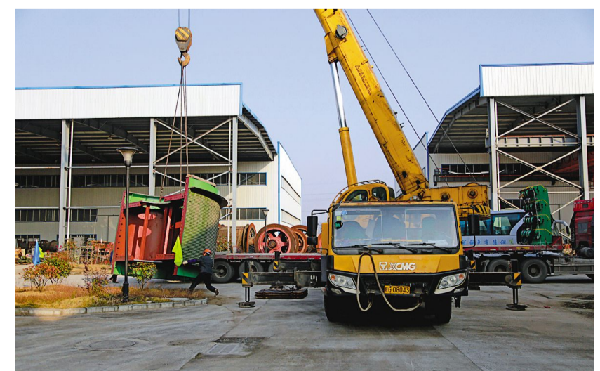
铜冠矿建公司职工正在吊装新辅助井设备。铜冠矿建公司于2016年底新接了冬瓜山铜矿新辅助井施工建设任务。为确保施工按网络计划及时有序开展,新年一开始该公司积极从新基地加大了施工设备的发送工作,全力做好新年施工设备保障工作。

管党治党重在日常、贵在恒。我们要拿出恒心和韧劲,坚持不懈做好全面从严治党各项工作,向党的十九大上改进作风、严明纪律、惩治腐败的优秀答卷。人民日报