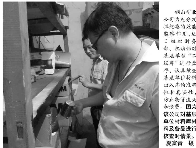
铜山矿业公司为充分发挥纪委的效能监察作用,近日组织财务部、机动部对基层单位“二级库”进行盘存,认真核查基层单位材料出入库的准确性和真实性,防止物资流失和浪费。图为该公司对基层单位材料库材料及其备品进行核查时情景。