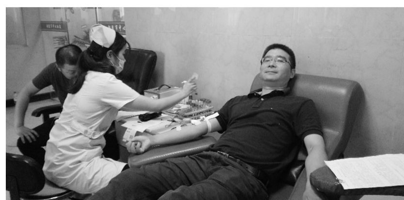
日前,金昌冶炼厂组织47名职工赴市中心血站参加无偿献血活动,通过献血前各项检验,其中有40名职工献血成功。