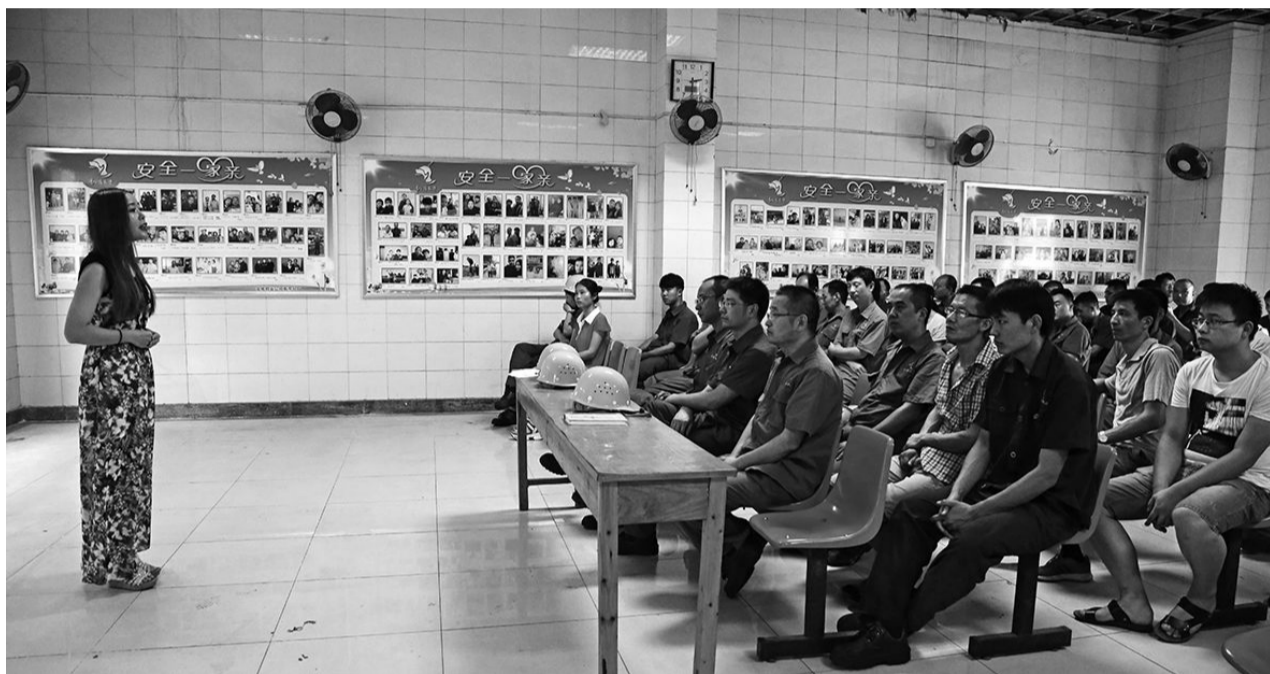
8月9日,金威铜业公司青年职工正在板带分厂开展安全巡回演讲。为提高广大职工的安全生产意识,规范安全操作行为,金威铜业公司生产制造部与团委联合组织了走进生产一线的安全巡回演讲活动。活动中挑选了5名团员青年到板带分厂、熔铸分厂等生产一线展开安全巡回演讲,通过他们讲述发生在身边的安全事故案例,生动地阐述了安全生产的重要性,引起了一线职工的共鸣。