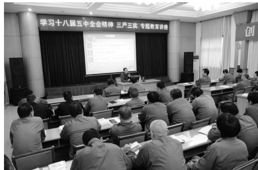
日前,铜陵有色稀贵金属分公司组织党员干部认真学习贯彻党的十八届五中全会精神,邀请铜陵学院教授为党员干部和职工讲授五中全会精神,提高大家对全会精神的理解,以便更进一步以全会精神指导各项工作。