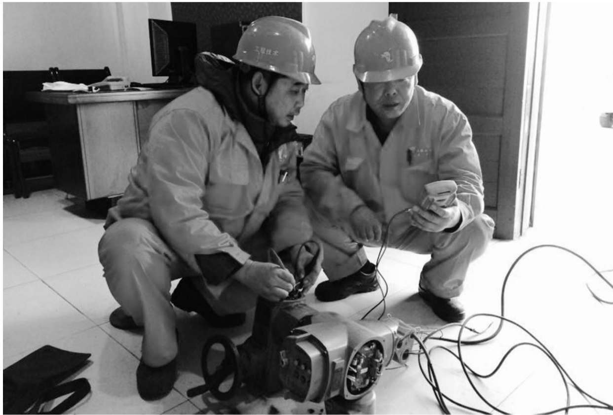
日前,工程技术分公司冶化项目部电机班维修人员正在修复进口调节阀。今年以来,该项目部积极响应公司挖潜降耗的号召,扎实开展修旧利废工作。电机班维修人员利用工余和休息时间修复双调节阀、电磁阀、接触器、变频器等多种设备,变废为宝,有效降低了维修成本。