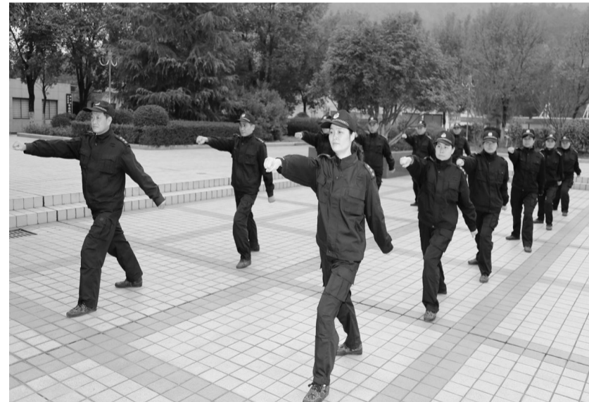
为提高保卫人员的身体素质和军事技能,更好地为矿山发展保驾护航,冬瓜山铜矿坚持每年开展军事训练活动。日前这个矿组织12名军训人员进行了为期一周的三大步伐、擒敌拳等科目的训练。