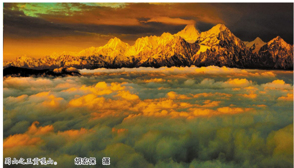
蜀山之贡嘎山。

在与阿姨道别时，阿姨热情留下儿子的名片，告诉我俩，如果来土楼，只要打电话给他们家，一定会受到热情接待。