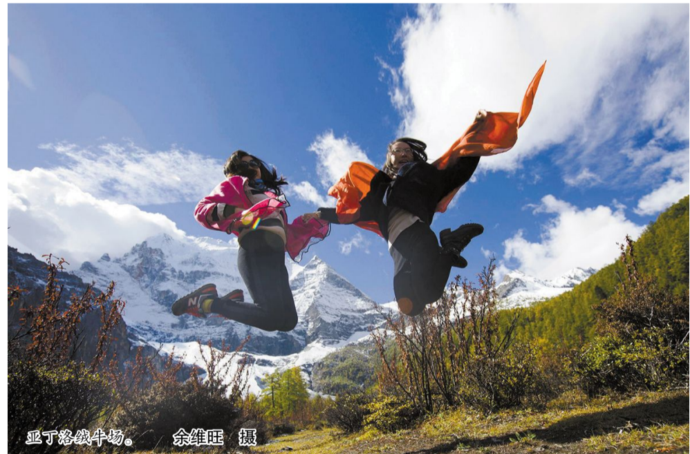
亚丁洛绒牛场。