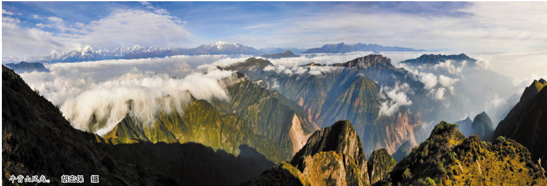
牛背山风光。胡宏保 摄