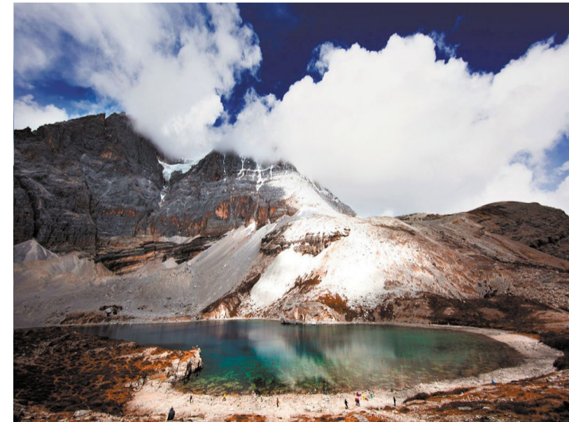
亚丁五色海。