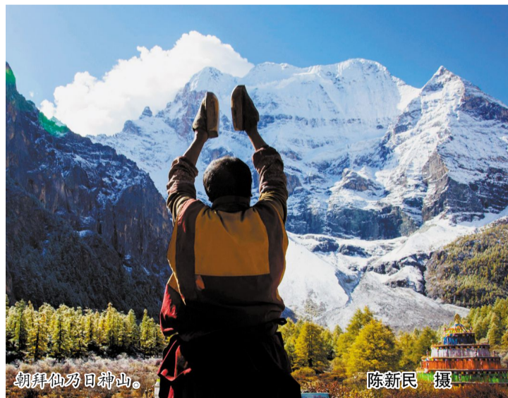
朝拜仙乃日神山。