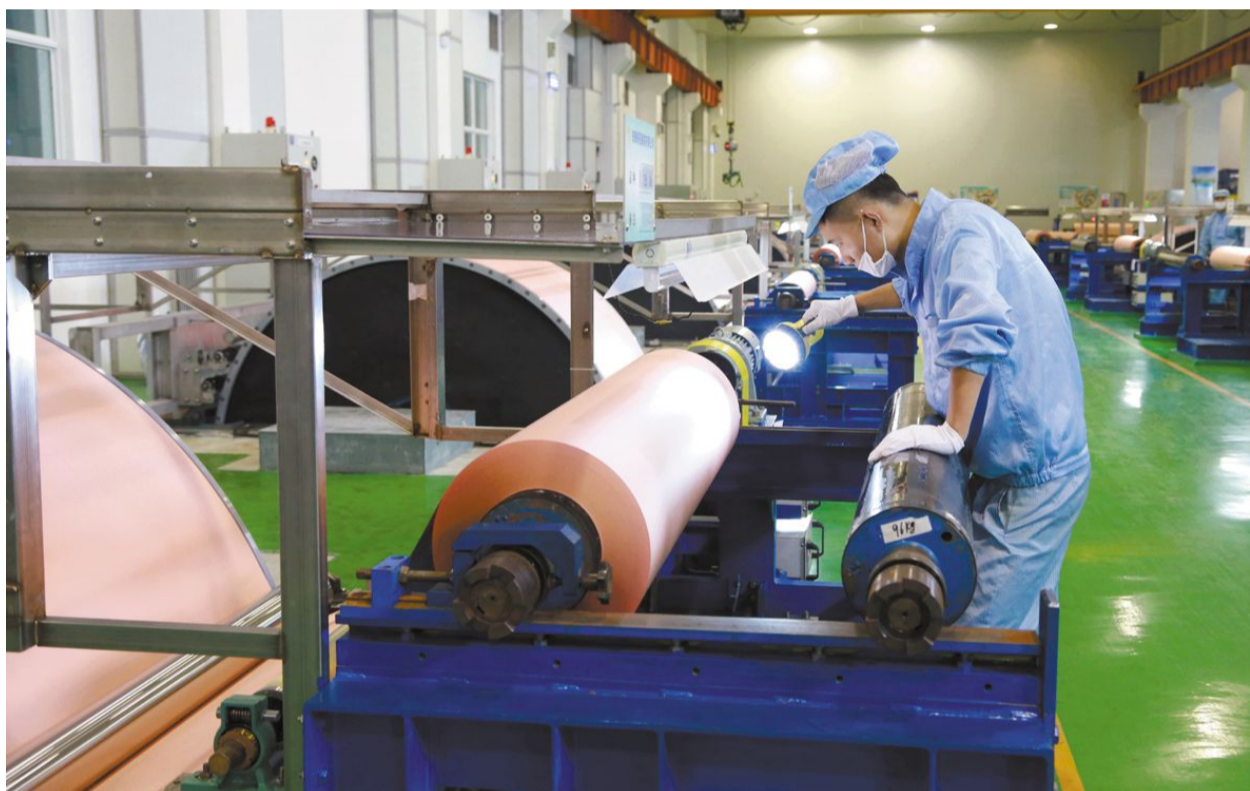
铜冠铜箔公司职工目前正在铜箔生产中作业。铜冠铜箔公司组建以来大力创新发展，积极开展了《环保型超薄电子铜箔工艺技术研究和产业化》项目，经过几年的不断钻研，项目取得了成功，形成了高性能印制电路板环保型电子铜箔的生产工艺技术、新型锂离子电池用双面光超薄电子铜箔制造工艺技术等一系列关键技术，使我国高性能电子铜箔的生产工艺技术达到国际先进水平。项目产品综合性能达到国际先进标准，大幅替代进口，大大推动了我国电子信息产业基础材料产业的发展。日前，这一项目通过中国有色金属工业协会评价。

本报讯 铜冠地产公司将“强化监督重过程”注入公司各项管理，实现安全环保常抓不懈，房屋质量不断提高，项目品质持续提升。 下半年来，该公司进一步强化安全环保常抓不懈，通过持续开展工程现场安环驻点督查和“回头看”活动，认真做好对工程施工的监督和管理工作。通过持续加强对外来施工单位的监管，并加大处罚力度，减少“三违”现象的发生，保持安全形势持续稳定。 为保证房屋质量持续提升，该公司强化“以质量树品牌”的理念，并将强化监督注重过程不折不扣落实在日常管理中。该公司下移管理重心，结合安环驻点活动，加强施工过程的质量监督，发现质量问题立即限期整改。认真总结、分类整理房屋质量共性缺陷，针对房屋质量通病，积极开展QC小组技术攻关，制定专项解决方案，避免后续项目出现类似问题。