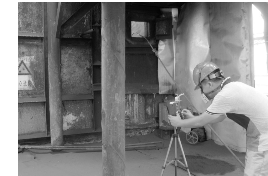
铜冠冶炼分公司定期对现场的职业危害因素进行监测,建立日常监测数据,并按规定对职工定期进行健康体检,完善员工职业健康管理档案。图为专业检测人员正在对球团回转窑窑头危害因素进行检测。

为充分发挥职工在生产过程中的主人翁作用,该公司加大劳动竞赛考核奖励办法。对“出矿、提升创新高”竞赛、“露天供矿”竞赛和“提高选矿经济技术指标”竞赛实行月度考核兑现奖励;对“掘进高效”、“中深孔会战”采取按时间节点完成生产任务,工程竣工验收收