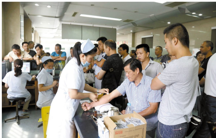
日前，有色冬瓜山铜矿组织100余名职工赴市中心血站参加义务献血。据了解，这也是该矿连续18年组织职工义务献血，累计献血量达41万毫升，并多次荣获铜陵市献血先进单位称号。图为该矿职工义务献血场景。

（金）金森达铜矿位于刚果金东南部的KATANGA省境内，距赞比亚CHIN-GOLA边境约五公里之遥。该项目是铜冠矿建公司成功进入赞比亚、津巴布韦后，开辟的国外新的市场，并在刚果（金）成功注册了全资子公司。该公司员工将海外工程当作彰显铜陵有色风采的重要平台，首次突破单月掘进百米大关，得到了海外业主的充分肯定，也为该公司准备商谈的二期工程赢得了主动。本报记者 江君 通讯员 陶莉