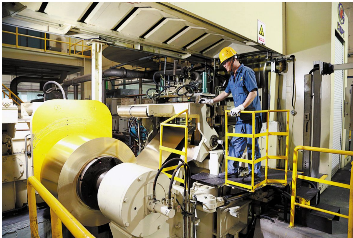
金威铜业公司职工正在新投入生产运行的中轧机前作业。今年以来，金威铜业公司积极以加强“5S”管理、设备改造、工艺改进、QC小组攻关、标准化操作为手段，不断促进了产品质量提升。特别是新投入运行的中轧机，为粗轧机和精轧机之间增添了一道轧制工艺，有效改善了板带产品轧制效果。上半年，该公司产品综合成品率达到57.79%，较年初目标提高近0.3%。

2006年，刚满30岁的钱贵宾从铜山矿应聘到铜冠冶化分公司动力车间干发电工。从未接触过发电这一行业的钱贵宾，刻苦钻研，虚心求教，不懂就问。他学看流程图、了解设备、熟悉操作、勤问、勤跑、勤动手，很快就成为余热发电班的中坚力量。三年后，他被车间选聘为余热发电班班长。汽轮机发电机组日常巡检涉及到振动、温度、压力、转速等一系列重要参数，稍有异常就会导致保护装置动作，造成停机事故。钱贵宾以“严、细、实”三原则要求大家，巡检时做到严谨、细心、务实，不漏检、不套表。去年3月的一天，正在现场巡检的钱贵宾对设备点检时，发现1号汽轮机高压油动机处出现裂痕，机油正往外大量喷射，当时情况紧急，蒸汽压力大、温度高，易使机油着火燃烧引发火灾。他果断处置，下达了紧急停机指令，并将情况立即报告给领导和相关部门，避免了一起设备事故，受到领导的表扬。