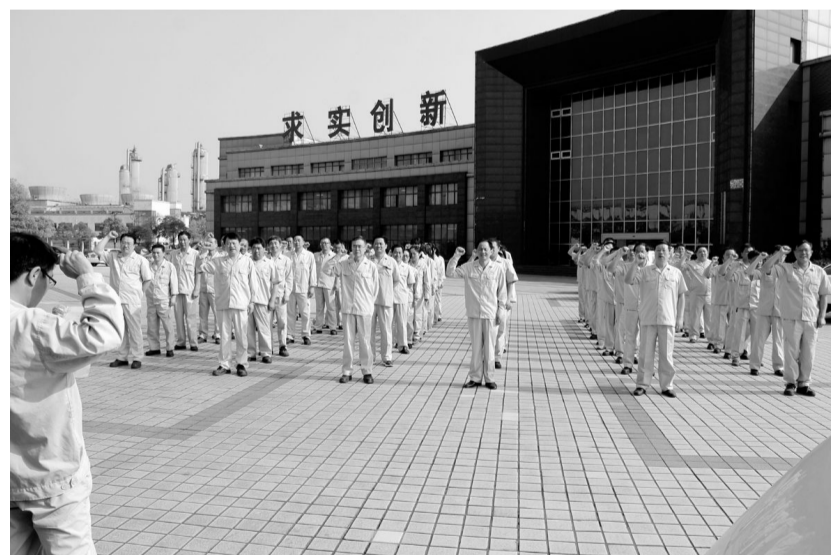
为把“安全环保、意识先行”活动落到实处，铜冠冶化分公司除开展安全环保培训、安全环保演讲赛、反“三违”查处、“安全一家亲”等活动外，每周还举行一次安全宣誓，旨在通过系列安全环保警示，将该公司安全环保工作提高到一个新的水平。图为职工在铜冠冶化广场举行安全宣誓活动场景。

加强教育，提高安全技能。为确保竞赛活动开展的扎实有效，该公司于近期专门制定印发《“三违”行为管理实施细则》，每个员工人手一册，并将安全环保管理目标进行层层分解，公司与14个基层单位、各基层单位与班组、班组与个人层层签订了“安全生产责任书”，明确竞赛活动的目标、竞赛活动以“安康杯”安全生产竞赛活动为契机，在全矿组织开展起“十一个”活动，不断提高广大职工的安全意识。