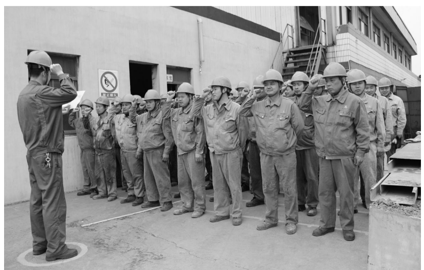
5月11日，张家港铜业公司精炼车间员工正在进行上岗前安全宣誓。自开展“安全环保、意识先行”活动以来，该公司广泛开展上岗前安全环保宣誓活动，使全体员工从思想上始终绷紧安全环保这根弦，做到防患于未然。