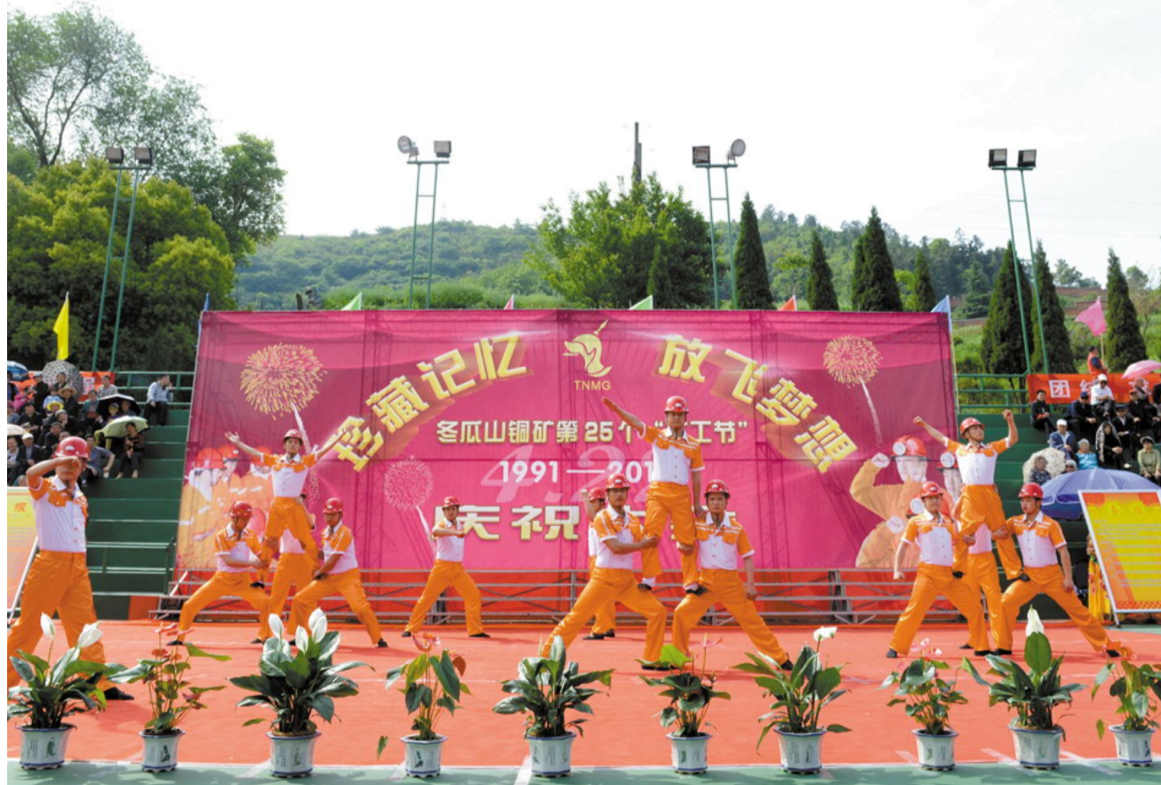
“五一”前夕,为丰富广大职工节日文化生活,冬瓜山铜矿文艺骨干自编自演了一台以“珍藏记忆、放飞梦想”为主题的文艺节目(如图)。铿锵的节奏,欢快的旋律,优美的舞蹈,表达出广大员工对矿山的赞美和未来的憧憬之情。同时,让矿山呈现出一派入如海、歌如潮的节日欢乐景象。