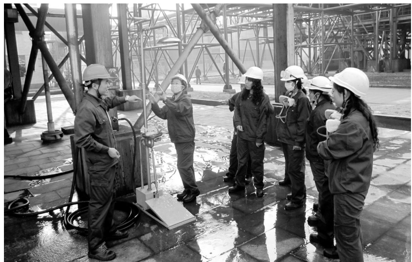
铜冠净化分公司综合车间注重强化取样,化验人员等现场作业人员应急救援知识的教育、培训和对应急器材的使用演练,提高了员工应对危化品泄漏的安全防范和处置能力。图为该车间组织相关人员正在现场演练。