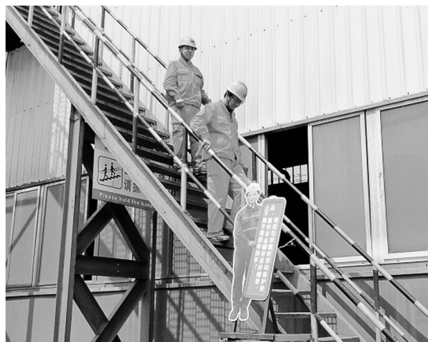
近日,冬瓜山铜矿精矿车间在车间工作场所的上下楼梯旁,设立模拟安全督察员,温馨提示岗位职工:“请规范穿戴好劳动防护用品,戴好安全帽系好帽带,上下楼梯抓牢扶手!”进一步提高员工安全意识,重视安全生产。