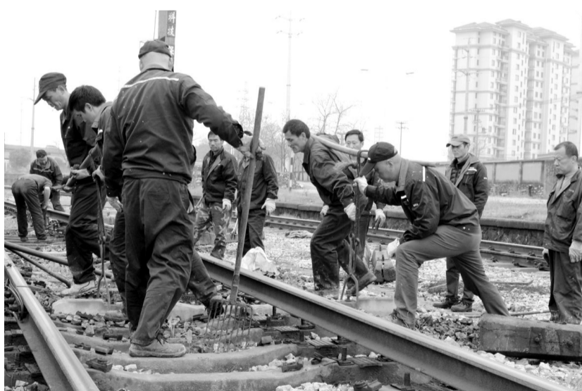
铜冠物流全铁分公司余家村站10道是正线股道,是调车作业和开行列车小运转主要股道之一,机车运行频率高,线路负荷重,轨枕易损坏。每年全铁物流分公司都要投入一定的人力和物力对该线路进行维护,以保证生产安全。图为该分公司工务段线路工在余家村铁路调车场10道集中更换水泥枕。邹卫东 摄

通过此次演练,进一步强化了食堂管理人员的责任意识,严格食品进货的索证制度,完善各类台账,抓好食堂规范管理,不断完善应急响应体系和各项措施,切实保障医院职工和住院病人的饮食卫生安全。 董绪龙