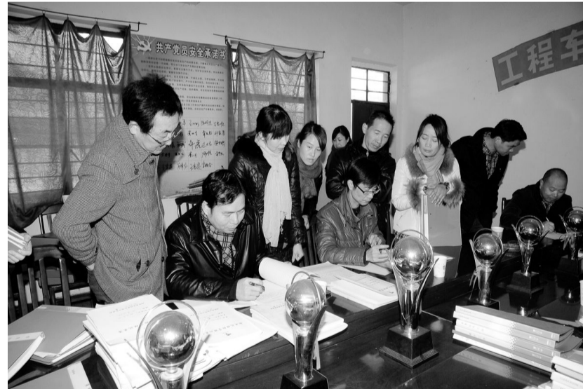
连日来,凤凰山矿业公司开展了第四季度标准化班组检查考核工作。此次检查是以集团公司标准化班组建设检查验收标准为依据,重点对各班组安全生产管理、对标管理、5S管理基础台账和班组园地建设工作开展情况进行检查。图为认真检查现场。