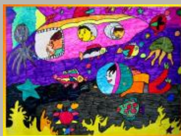
海底乐园 韦嘉霖(六岁) 二幼 指导老师:徐永慧