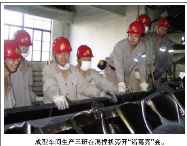
成型车间生产三班在混捏机旁开“诸葛亮”会。