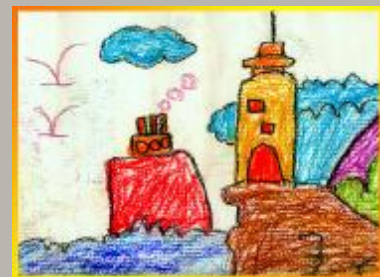
灯塔 农秋雷(5岁半) 一幼 指导老师:凌莹莹