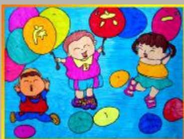
庆六一 李兆渊(六岁) 二幼 指导老师:李诗琪