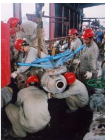
广西分公司用科学管理方法组织氧化铝铝系停汽检修,确保“安全生产、检修质量、计划时间”三落实。在现场,检修工人战高温,不畏艰难,表现出了崇高的敬业精神。图为停汽检修工作场面。

目前,江洲生活区住户私家车越来越多,停在路边又不允许,矛盾非常突出!建议有关部门派人到江洲实地考察情况。在此,呼吁在江洲修建停车场,解决江洲职工停车难的问题。 更新和生活区一住户