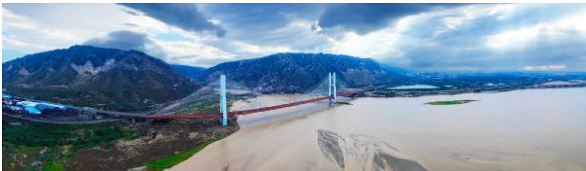
万里黄河出龙门

搁笔在眸中 着笔处燃烧着氤氲的光 此时 心里映照着你热烈的镜像 想或不想都是思念绵长 说或不都说都会守在身旁