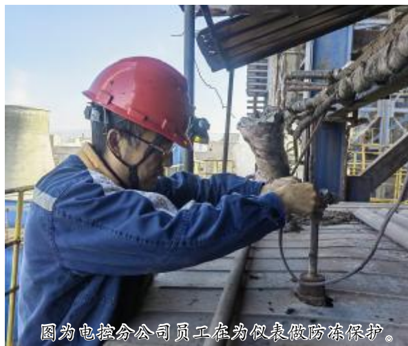
图为电控分公司员工在为仪表做防冻保护。

之前,厂区澡堂供热系统管道采用并联方式,经常达不到供暖温度,为了改变这一现状,该中心决定对供热系统实施改造,把管道并联模式改为串联。串联管道能使各个暖气片均匀受热,大大提高室内温度,且串联管道结构简单,后期维护和管理相对容易。该中心高度重视改造项目,专人负责监督改造过程,经过15天的努力,改造完成。改造后,澡堂的水资源和热能得到了更合理的分配利用,同时,串联模式也使水温更加稳定,为员工带来更为舒适的洗浴环境,也提升了服务质量。(温冲)