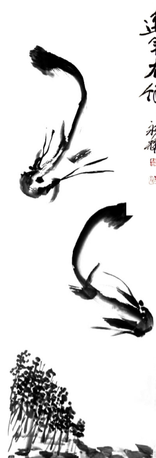
连年有余 鹿永耀 国画