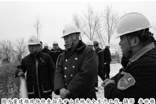
图为董建雄现场检查指导矿山系统安全生产工作。

劲旅讯 2月19日至21日,中铝集团党组成员、副总经理、中铝股份董事长董建雄到山西推进办、山西华兴、山西中润、山西新材料和十二冶等中铝驻晋企业调研,深入生产一线开展新春慰问,听取贯彻落实中铝集团和经营单元职代会精神情况汇报,并开展节后安全生产检查。