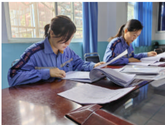
近期,热电厂严格落实公司党委下发的“清风行动”工作方案要求,组织专业科室纪检工作人员,排查生产管理中存在的廉洁问题,强化自查自纠及整改,堵塞管理漏洞,共排查廉洁风险点12个,自查自纠问题5项,积极营造风清气正干事创业的政治生态。

随着近期雨水增多,山西铝业农贸市场出现排水不畅现象。9月3日,商贸市场运营科立即行动,组织党员干部轮流作业,利用一上午时间,完成沟渠管线清理任务。行动中,党员干部不怕脏、不怕累,趴在地上,下到沟渠内进行了全面清掏,将堵塞下水道的垃圾全部清理干净,彻底解决了排水不畅问题。(刘佳 刘立新)