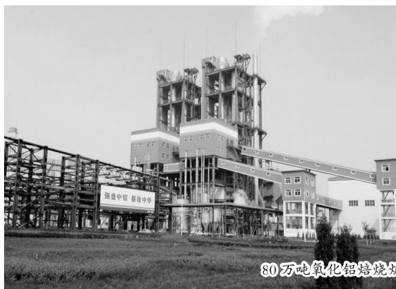
80万吨氧化铝焙烧炉。

山西铝厂改制后,按照“依托基地,走向市场;融入社会,合作共赢;改革创新,科学发展”