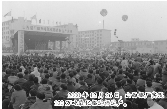
2000年12月26日,山西铝厂实现120万吨氧化铝达产。

任家庄、康家庄两个村庄的搬迁成为新项目开工的头等大事。搬迁组挨家挨户做工作,千方百计解除村民的后顾之忧。党员干部带头搬迁,广大村民投亲靠友,主动搬迁,短短两个月就完成了两个村庄的搬迁,为工程开工建设赢得了宝贵时间。