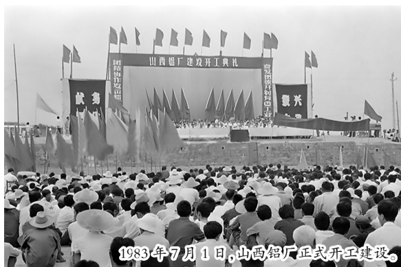
1973年7月1日,山西铝厂正式开工建设。

期间,由于国家经济计划的调整,山西铝厂的筹建工作步履维艰,项目几上几下,方案数次变化,过程起起落落。但晋铝人矢志不移、执着坚守、拓荒奋进、艰苦奋斗,经多方极力争取,在国家和原冶金部、地方政府的关心