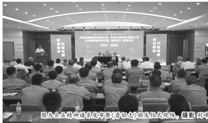
图为《晋铝志》颁发仪式现场。