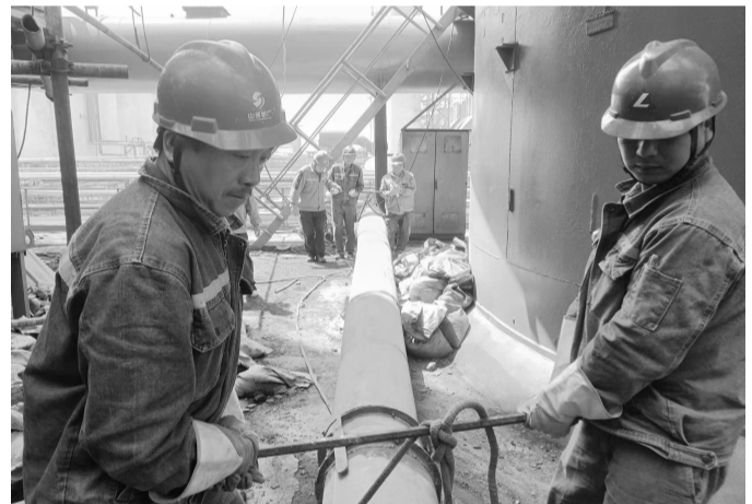
为了满足生产需求，提高运行效率，近日，山西中铝工服设备安装检修车间对精细氧化铝事业部石灰炉收尘管道进行改造。为了安全、高效、优质地完成改造任务，该车间提前制定计划，施工人员克服现场空间狭窄，需人工转运等不利因素，加班加点作业，截至目前，已完成10米管道的连接、焊接任务。图为员工在运送管道。摄影报道 台玉娥 王军杰

该段实施双重考核制度，使故障早发现、快处理；通过线上与线下结合，开展多项安全活动；以“五带头”为抓手，对动车、机车启机及运行等危险作业、标准化作业环节等重大事故隐患开展排查整治，积极开展应急救援演练。该段构建人防、物防、技防“三位一体”的现代化铁路安全保障体系，严格落实“每周走遍所有岗位查找隐患”制度，现场制定需物理隔离、及时消缺措施，利用视频监控实时监督机车、车辆运行状况，及时指出违章行为，制定整改方案，跟踪整改结果。在排查过程中，共处理隐患6起，纠正习惯性违章作业2起，保障了铁路运输安全。(丁剑锋)