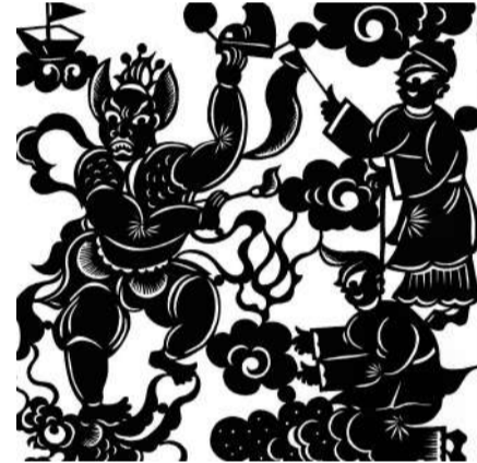
拜魁星 剪纸 杨毅