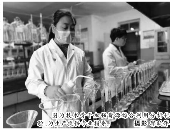
图为技术骨干加强资源综合利用分析化验,为生产提供专业指导。

下一步,中铝山西新材料党委将不断深化“党建+科技创新”,发挥央企优势,持续将党建软实力转化为科技创新的新动能,全面提升公司科技创新工作水平,勇担山西省铝镁精深加工产业链“链主”企业重任,争做“生态优先、低碳转型”发展的“排头兵”。