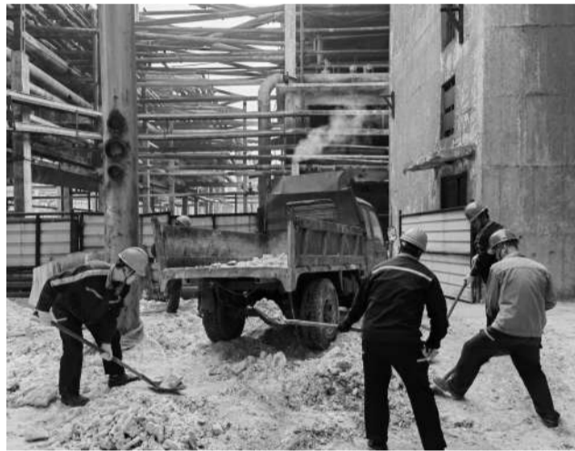
近日，资源综合利用分公司分解工区党支部党员干部将二十大精神与工区实际工作相结合，与降本增效、价值创造相结合，直面困难，主动出击，利用休息日清理转运分槽下结疤，并返入生产流程100余吨，将贯彻落实党的二十大精神转化为实实在在的火热实践。图为党员义务献工现场。