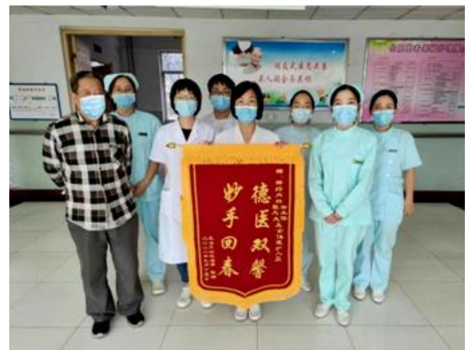
9月15日,一名患者及其家属来到山西铝厂职工医院,向神经内科全体医务人员送来锦旗表达感谢。