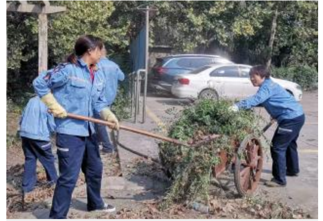
9月16日,石灰石矿事业部组织10名党员,对矿部大院及周边绿化带进行大整治,参与人员奋战5个多小时,修剪冬青、月季等百余株,清运垃圾70余方,有效改善了现场面貌,以干净整洁的环境,迎接党的二十大胜利召开。

压铁清理及标准、阳极保温材料添加等精细化操作,同时针对“封极五步法”、“换极七不准”以及新的操作方式进行现场培训,通过理论和实际相结合的教学,促进了员工在综合素质和履职能力等方面的提高,形成了“比学赶超”的良好氛围。(汪丽丹 杨春亮)