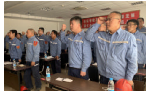
新老党员面对党旗宣誓(电解厂)

劲旅讯“七一”前夕,中铝山西新材料、中铝山西铝业各单位开展形式多样的活动,庆祝中国共产党成立101周年。在活动中,员工们回顾党的光辉历史,缅怀党的丰功伟绩,激励广大党员传承红色基因,赓续百年征程。 6月27日,电解厂隆重召开“七一”暨14万吨电解铝复产达标动员会。会上,新党员进行了入党宣誓,老党员重温入党誓词,会议表彰了15个先进集体和47名先进个人,安排部署了14万吨电解铝复产达标工作。会议要求全体党员、干部要坚持以习近平新时代中国特色社会主义思想为指导,树牢“四个意识”,奋发有为,砥砺前行,坚决完成14万吨电解铝复产达标目标任务,以优异的成绩向党的二十大献礼! 6月27日,热电分厂召开纪念建党101周年暨“七一”表彰大会,会上,全体党员重温了入党誓词,表彰了先进,总结了上半年工作,对下半年工作进行安排。大会动员广大党员干部认清形势,坚定信心,为完成全年各项目标任务而努力奋斗。 6月28日,氧化铝厂召开纪念建党101周年暨“七一”表彰大会,总结回顾前一阶段工作,表彰了先进基层党组织、优秀共产党员和优秀党务工作者。会议还对生产全要素对标工区、明星班组长、明星员工、二季度流动红旗竞赛获奖单位进行了表彰。会议号召全体党员干部要履职尽责,迅速掀起大干高潮,扛红旗、站排头、当先锋,确保完成各项任务目标,以优异成绩向党的二十大献礼! 6月28日,石灰石矿事业部召开建党101周年纪念大会,会上全体党员重温了入党誓词,表彰了1个先进党支部和6名优秀党员、4名优秀党务工作者。会议回顾了中国共产党101年的奋斗历程,同时要求全体党员完善党建工作责任制实施细则,深度融合党建与中心工作,开拓市场创新创效,确保氧化铝石灰供应的顺利完成。 6月28日,为庆祝中国共产党成立101周年,营销中心党总支带领党员干部到天津市“邓国栋纪念馆”、万荣县“薛瑄廉政文化教育基地”参观学习,激励大家以昂扬的斗志、饱满的热情、旺盛的干劲,完成各项任务目标,以优异成绩迎接党的二十大胜利召开。 为庆祝中国共产党成立101周年,6月28日,武装保卫部组织党员干部到望里乡平原村参观薛瑄廉政文化教育基地。在薛瑄纪念馆前,全体党员面对党旗,重温入党誓词,现场还对2021-2022年度10名优秀共产党员进行了表彰。 6月28日,山西中铝铝工服公司举行“比技能 强党建”技能竞赛暨纪念建党101周年庆祝大会。会议表彰了2个先进党支部、10名优秀共产党员、7名优秀党务工作者,并为技能竞赛优胜者颁奖。会议要求全体党员干部落实责任,率先垂