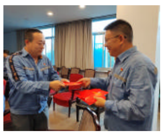
赠送“廉洁倡议书”(营销管理部)