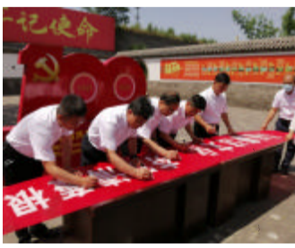
廉洁从业签字(矿业公司)

事,纷纷表达对党的生日的祝福。 七一前夕,后勤保障中心各党支部开展了形式多样的主题党日活动。物业板块党支部组织党员进行了义务劳动,开展环境卫生大整治活动;其他各党支部由党员骨干成立防汛突击队,准备防汛物资,开展防汛预演,把党员先锋模范作用落在实处。 “七一”前夕,矿业公司党员干部到孝义市梧桐镇仁坊村“中国共产党孝义建党第一址”参观学习,大家一起观看了《戒尺》等反腐倡廉警示教育片,并在反腐倡廉宣传月主题条幅上郑重签下名字。之后,全体党员重温了入党誓词,表达了为党的事业奋斗终身的决心。 7月1日,技术研发中心召开纪念中国共产党成立101周年暨“七一”表彰大会,会上,全体党员重温了入党誓词,党总支书记为大家上了一节题为《坚定不移 将作风建设进行到底》的专题党课。会议号召全体党员干部要进一步解放思想,主动担当作为,勇于开拓创新,以优异成绩迎接党的二十大胜利召开。会议还对6名优秀共产党员进行了表彰。 7月1日,电控分公司召开纪念建党101周年大会。会上,全体党员重温了入党誓词,会议传达了山西新材料党委庆“七一”大会精神,并对2021-2022年度的优秀共产党员进行了表彰。 (综合报道)