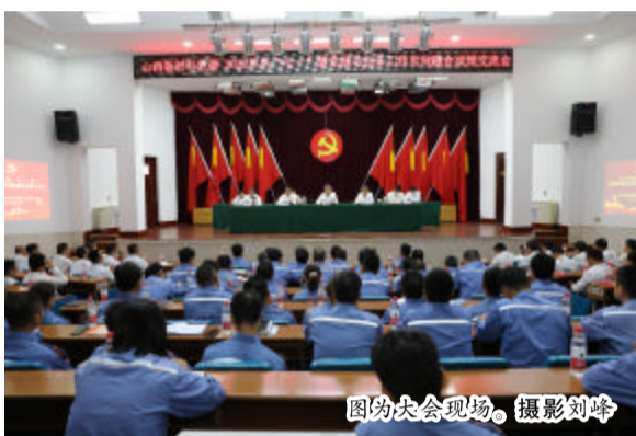
图为大会现场。

劲旅讯(夏雷)为庆祝中国共产党成立 101 周年,6 月 29 日,中铝山西新材料党委召开庆“七一”暨党建与业务工作双向融合成果交流会,庆祝党的生日,讴歌党的丰功伟绩,展示党建工作成果,表彰激励先进典型,动员广大党员和干部员工进一步赓续建党精神,努力拼搏奋斗,对标赶超一流,改革创新融合,不负使命、勇毅前行,为企业高质量发展贡献更大力量。