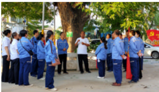
聆听革命事迹(山西中铝铝工服公司)