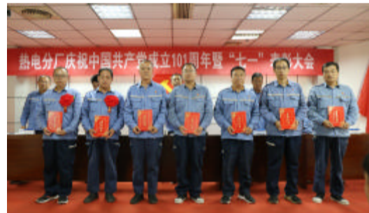
召开纪念建党大会并表彰先进(热电分厂)