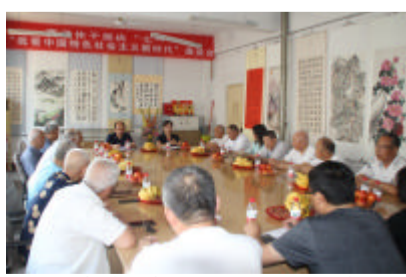
离退休党员为党送祝福(职工培训中心)