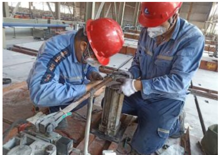
7月5日,电解一厂净化车间组织开展了岗位技术练兵活动,各班组长骨干在三净化除尘器14米平台上,完成了一系列除尘器气缸与电磁阀维护与更换任务。此次活动取得了预期效果,提升了员工的技术操作能力。