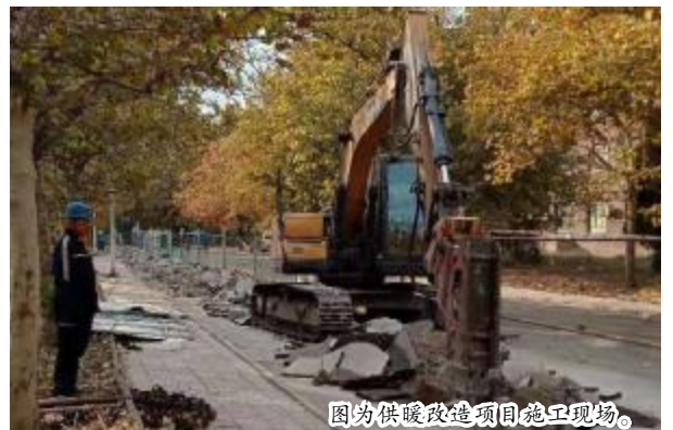
图为供暖改造项目施工现场。

此次家属区管网改造共需铺设管道约 5.8 千米,供暖面积 100 万平方米。目前,家属区外网改造管道施工基本完成,各施工点工程进展顺利,部分未完工的项目正在加紧实施。