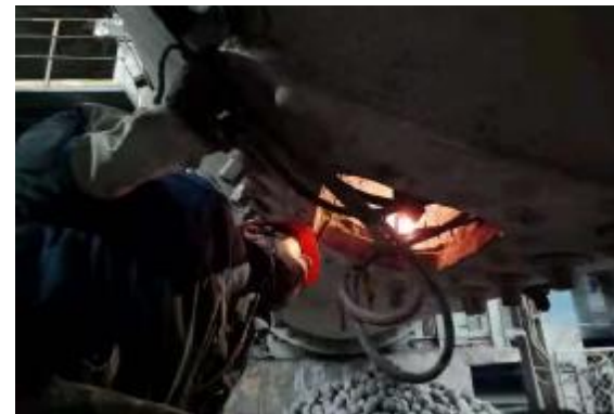
为保证生产稳定运行,近日,第一氧化铝厂配料工区组织对2号原料磨开展为期7天的检修,主要对衬板、隔仓板实施更换。图为员工在检修磨机。

该矿积极开展产量、成本、设备等方面劳动竞赛,重奖重罚,激发了员工的积极性。同时,各工区党支部通过支委会、党员大会、专题会等形式,每月对党员浪费辨识及整改等工作进行通报点评,建立跟踪台账,掌握工作进度,层层传递压力,进一步提高了员工思想认识,促进工作开展。选矿工区党支部采取停机减少空转等措施,累计节约斜井大皮带电耗3万度以上;采剥工区组织党员实施优化改造,成功解决潜孔钻电气线路故障频发的问题,节约费用2万余元;该矿利用生产检修时机,组织党员突击队到采场人工挑拣矿石,清理废石、土块1000余吨,保障了矿石质量合格率达到预期目标。10月份,该矿党委共实施党员带头、全员微创新项目7项,创效4.6万元。(石雷)