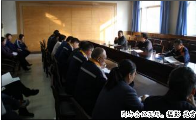
图为会议现场。

编者按: 自 10 月中旬“步入新时代、学习新思想、开启新征程、展现新作为、谱写新篇章”大讨论活动开展以来,全公司迅速掀起了学习宣传热潮,大家结合工作实际,认真撰写心得体会,并以讨论交流的形式谈体会、谈认识、谈举措、提建议,使活动最终落细落稳。为进一步统一思想、凝聚共识,《劲旅》特开办“五新”大讨论栏目,全面激发广大党员和干部员工坚定信心、乘势而上的热情和干劲,助推公司加快三大变革,加快提质增效,加快转型升级,坚决打赢安全环保质量攻坚战,推动公司实现高质量发展。