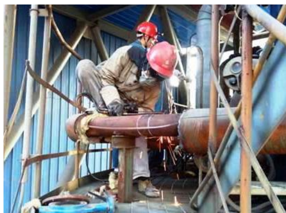
晋铝冶炼热动维检中心人员在热电厂1号脱硫塔除雾器水管加装阀门,保障塔内冷却和通风顺畅,方便漏水检修。

多工种协同作业现场完成电机、转子分离拆卸工作。由于该电机线包由铜扁线绕制,焊接牢固,为保证检修质量,检修人员合力翻转每个线包,将14个线包连接处绝缘层逐一拆开查看、检修、安装,最终顺利完成球磨机同步电机检修任务,试车一次成功。(郑向京 丁庆江)