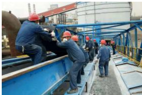
11月6日,华泽建安组织人员对冒雨电解厂2000米长仓储皮带实施更换。图为检修员工雨中更换皮带。