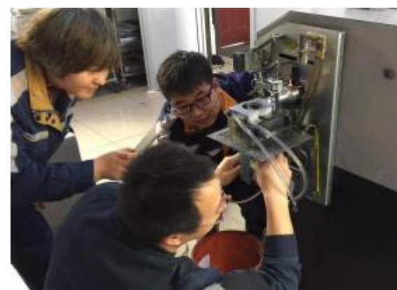
近日,技术研发中心质量检测科员工在光谱仪维护过程中,用眼镜布代替原有脱脂棉对光谱仪镜头进行擦拭,有效解决了棉丝堵塞管路的问题,节约了费用。