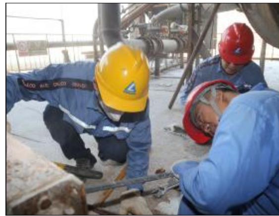
近期,第一氧化铝厂焙烧工区按照区域网格化管理,不断提高设备维护标准,增加自检权重,减少外委比例,保证维修质量的同时降低了外委检修费用,提升了检修效率。

业的实际,项目部组织人员认真分析,在确保电解槽置换的前提下,积极联系厂家,准确把握物料到货时间和到货量,提前安排现场工作,杜绝人员和设备等待现象,安全高效使用天车。(贺振中 吴海英)