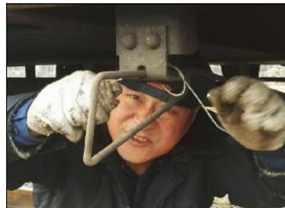
近日,物流运输事业部通过严格卡控作业人员检车各项环节,减少临修故障,不断提升车辆质量,提高车辆周转效率。图为检车员现场处置三通阀缓解迟缓问题。