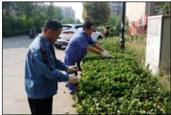
近日,生活服务中心积极组织人员清理绿化带杂草净化小区环境,部分小区群众也主动参与到清理劳动中,同时生活服务中心以此为契机向住户进行环保知识宣传,引导群众爱护环境,践行绿色生活理念,共建美丽社区。摄影报道 王海雷

铝加工事业部接到部分客户产品订单,要求锯切后端面误差不超过1毫米。为满足客户要求按时供货,该部组织技术人员多次讨论,决定恢复因操作复杂,员工操作不熟练而长期闲置的1号圆盘锯床;经设备管理人员系统排查,列出问题清单,检修人员和技术人员相互配合,逐一实施整改后,连续两周加班加点反复调试,圆盘锯床顺利投用。锯切后,测量端面误差小于1毫米,完全满足客户需求。(罗彦平 崔杰)