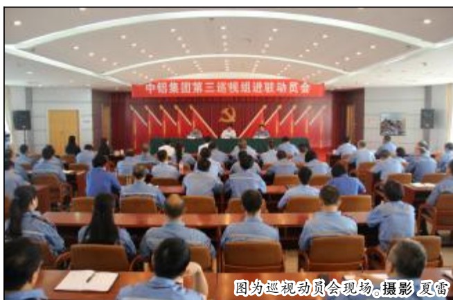
图为巡视动员会现场。

他强调,此次对山西铝业有限公司进行巡视,体现了中铝集团党组对山西铝业公司的高度重视,是对山西铝业公司党的建设各项工作的全面体检和有力促进。山西铝业公司党委和各级党员领导干部要在思想认识、责任担当上跟上中央和中铝集团党组的要求,严格履行党章赋予的职责,以巡视为契机,强化全面从严治党主体责任,切实把责任扛起来、立场硬起来、纪律严起来,唤醒党章意识、纪律意识、规矩意识和组织意识,尊崇党章、敬畏党纪,确保党的路线方针政策和中铝集团党组决策部署的