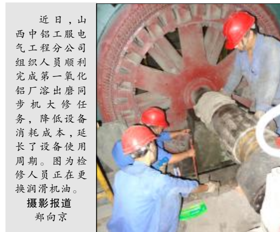
近日，山西中铝工服电气工程分公司组织人员顺利完成第一氧化铝厂溶出磨同步机大修任务，降低设备消耗成本，延长了设备使用周期。图为检修人员正在更换润滑油。

针对此问题，矿制工区组织对冷却水系统进行优化，改造原有废弃管道后接入蒸发水，引入高质量水源置换、补充循环水池，从根本上解决了水质差致冷却器结垢快的问题，冷却器酸洗频次降低，运行周期延长，有效节约了运行成本。目前，循环水维持在24至27摄氏度，高压供风稳定，满足了种分槽生产需求。（张娜 刘建峰）