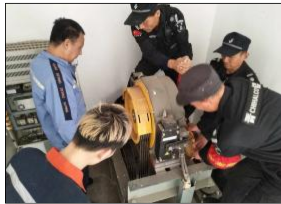
近日，生活服务中心晋铝物业公司西安分公司在高层住宅楼模拟电梯内发生困人故障，按照预案进行救援，检验电梯维保单位和小区物业的应急救援能力，促进电梯安全管理。 摄影报道 生活

历经12天连续奋战，5月6日，两台电解槽大修顺利交工，并一次试车成功，受到客户的高度赞扬，获得了良好的市场效益。（吕建杰）