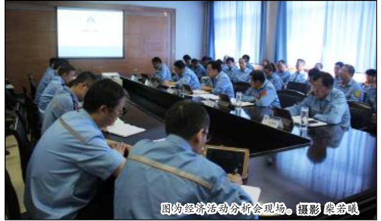
图为经济活动分析会现场。