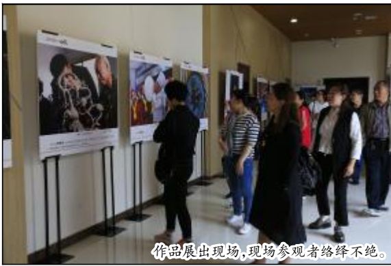
作品展出时,现场参观者络绎不绝。