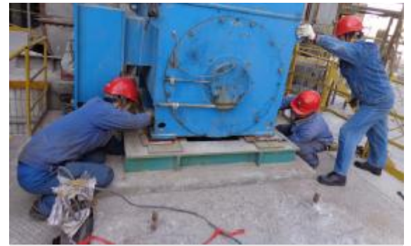
3月4日,中铝工服电器安装检修施工处接到第二氧化铝厂高压溶出电机检修任务后,组织人员仅用2小时就完成了电机更换,最大限度地保障了生产的连续性。摄影报道 郑向京

各种问题。产品发运科全员紧盯现场,科学组织,加班加点作业,密切关注仓存变化情况,及时调仓,同时组织装卸公司加大包装力度,在站台空地另辟13个货位,极大的缓解了仓储压力。经过努力,超额完成2月份氧化铝发运任务,单日包装氧化铝3528吨,单日装车65节,单日发路车84节,单日销售氧化铝9000吨。(冯云郭水霞)