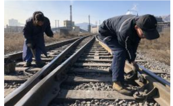
近日,物流运输公司工讯段采取工区合作的办法,组织员工对管辖内线路、信号结合部设备进行不间断巡检和排查,检修维护了数十公里线路,保障机车正常运行。

生产组织安排,强化带班领导值班,加大火车发运量;从正月初六起快速恢复汽车发运,迅速提升产量,保证2月份汽车发运量达到400车/天以上,日供矿量2万吨以上,形成稳产高产的良好态势,全月供矿完成计划的121.54%,铝硅比超出计划指标0.15。(侯李忠)