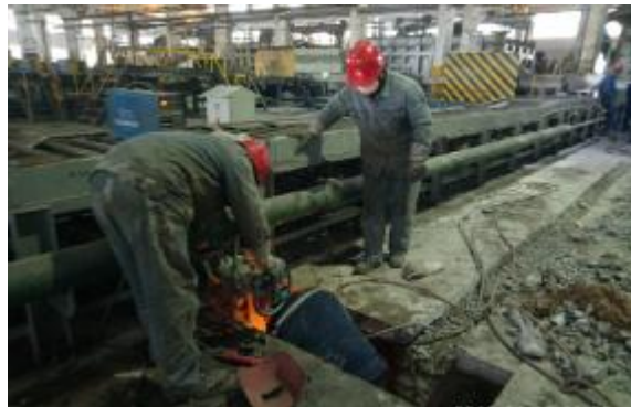
近期,河津华泽建安自控技术科对普铝工区9KG合金锭2号铸机线电气自控部分移位改造顺利完成。改造过程中,技术人员人工绘制电缆走向,对拆除电缆进行一一标记,精细测量,并校对接线,圆满完成电气自控接线任务,经联锁调试后,铸机线满足生产需求。

该车间本着“能修不换、降本增效”的原则,针对设备问题制定专项方案,组织专业技术骨干对原有重板电机和变频器进行扩容,更换电缆200余米,对配电室停下来相关电气回路进行全面进行吹灰、检查、紧固,用防火泥封堵电缆口;并对长期运转的电机,全方位无死角维护保养。同时结合日常改造期间安全经验,分析预判安全新变化、新风险,针对性完善细化应急措施,做实做细应急预案,详细测量分析电机各类特性参数变化,发现隐患立即处理,防患于未然,从根本上保障电气系统正常运行。(侯云云)