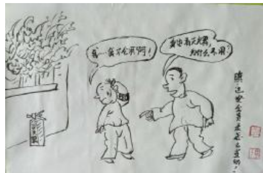
安全员不“安全” 山西中铝工服公司 董捐干