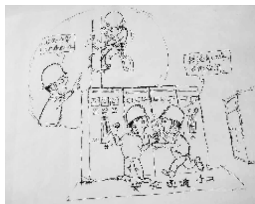
无“票”不工作 晋铝矿山工服公司 刘云海