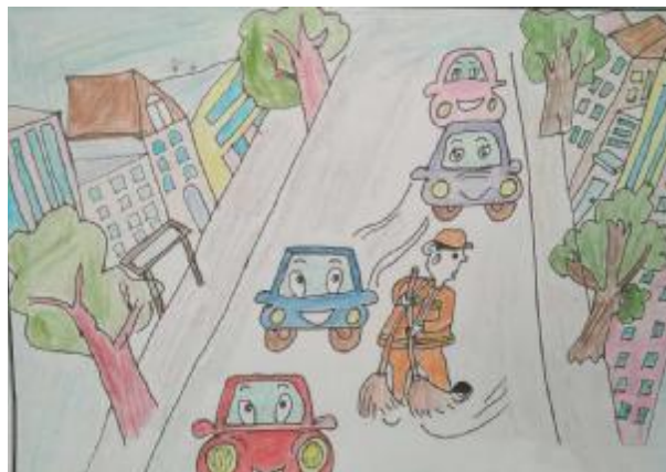
危险的清扫 生活服务中心 张玉平