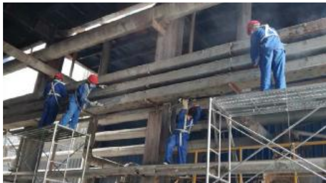
近日,晋铝冶炼公司电气车间三线整治工作全面开展,检修员工在高空、高温、高碱的作业环境下,对电缆桥架外部进行除锈刷漆、除灰、整理,确保线路干净整洁,便于维修查找。