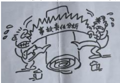
扯皮 第一氧化铝厂 李秋红