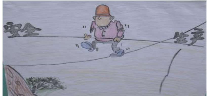
“走钢丝” 质检仓储中心 郑翔宇