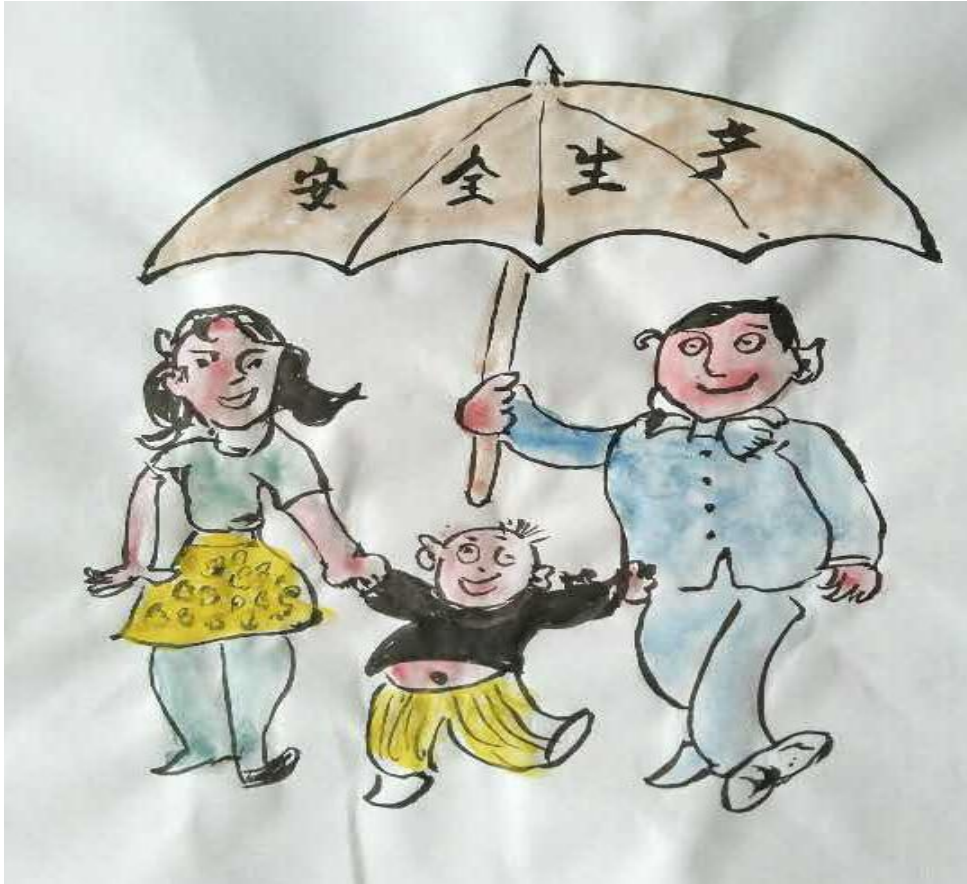
安全是家庭的“保护伞” 山西中铝工服公司 董捐干

六月,如同火热的天气一样,全国安全生产月活动开展得如火如荼。在30天的时间里,或许你要反复学习安全规程,再次聆听安全讲座,牢牢谨记安全月主题,或许,还要进行一次岗位安全操作考试……这一切的一切,都只为保障正在工作着的你我的平安,保障设备的正常运行,生产的持续稳定。这阳光绿树、山川河流,以及自然界的一切,父母儿女、丈夫妻子,和所有亲人们的爱都是你我平安的幸福。我们特别组织策划了一期安全漫画专版,由企业不同岗位的员工亲手创作,希望您会在会心一笑之际,也能收获一点启示。愿月月都是安全月,岁岁都是平安年。