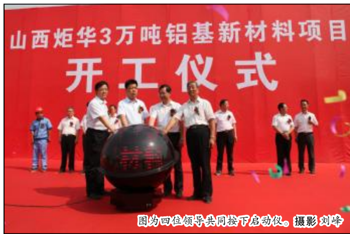
图为四位领导共同按下启动球。

劲旅讯(杨红)6月19日,山西炬华3万吨铝基新材料项目正式开工,标志着运城、天津两级市政府与山西铝厂合作建设的天津铝工业园,迈入了良性发展的快车道。天津市市长赵建喜,副市长贺红林,运城市天津工研院调处副主任李朝霞,中铝股份山西分公司党委书记、总经理王龙章,山西铝厂厂长王天庆,党委书记张智,山西炬华新材料科技有限公司董事长郭万里、总经理郭晓琛等领导出席开工仪式。