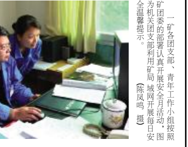
一矿员工素质培训开班。图中为培训现场。