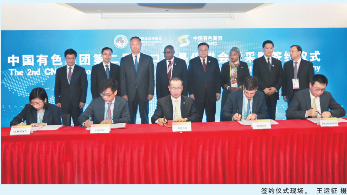
签约仪式现场。