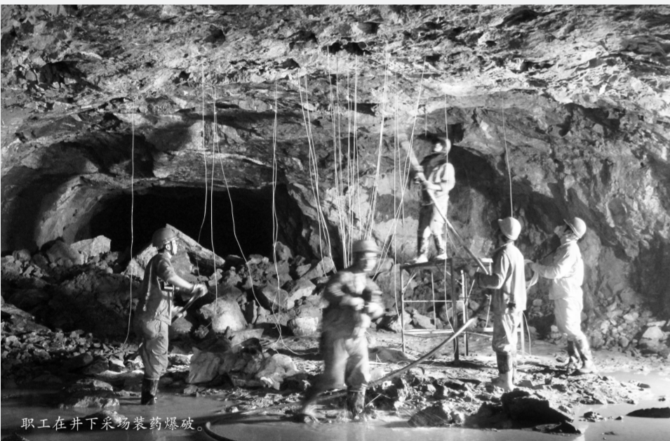
职工在井下采场装药爆破。

8月份,矿业分公司铜绿山矿完 成矿山铜962.05吨,实现报表利润 2453.56万元,考核利润1451.42 万元,较目标利润增利558.63万 元。在缩小欠利的道路上前进了一 大步。