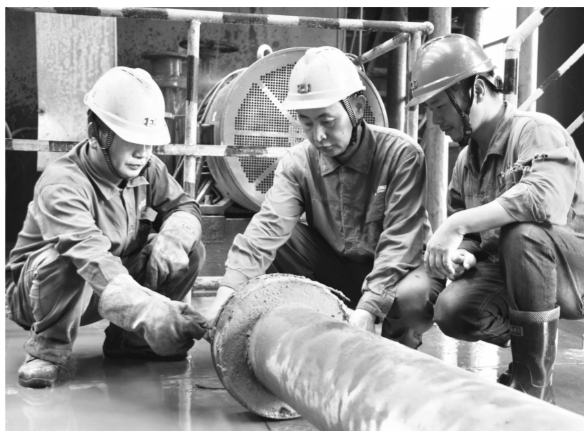
▲党员立足岗位增利创效。

严格按照个性化、可操作的原则, 推进党员先进性量化考核落地。各 级党组织根据党员岗位实际情况, 优化完善了党员“一人一表”考核 细则,每月对党员先进性量化考核 结果进行公示,并将考核结果与 “每月一星”评比挂钩,每月给予 不低于100元的奖励,有效地促进 了党员的工作积极性和主动性。通 过一系列党建活动的开展,充分发 挥了党组织的战斗堡垒作用和党 员的先锋模范作用,涌现出了一批 先进集体和先进个人,其中,2家基