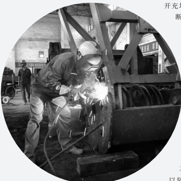
▲维修人员焊补精矿仓抓斗创效益。

【编者按】在全公司“大干三季 度、奋力夺高产”的大潮中,矿 业分公司铜绿山矿在多重困难 的叠加下奋力前行,8月份实现 超利,用实际行动兑现企业增效 、员工增收的承诺。“潮平两岸 阔,风正一帆悬”。进入九月份, 该矿直面欠利迎头赶上,以出色 业绩献礼新中国七十华诞。