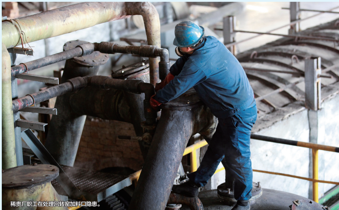
稀贵厂职工在处理回转窑加料口隐患。