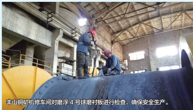
丰山铜矿机修车间对磨浮4号球磨衬板进行检查，确保安全生产。