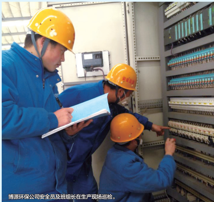
博源环保公司安全员及班组长在生产现场巡检。