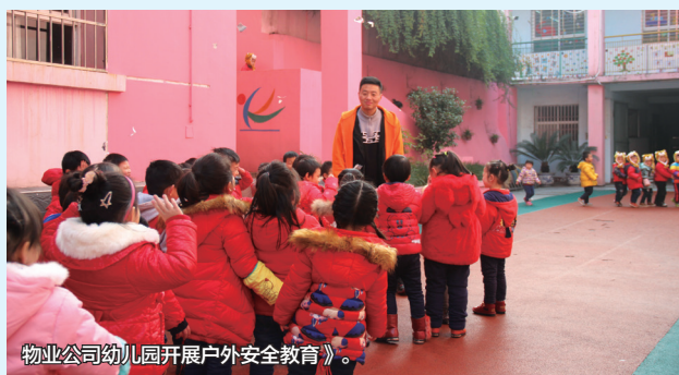
物业公司幼儿园开展户外安全教育》。