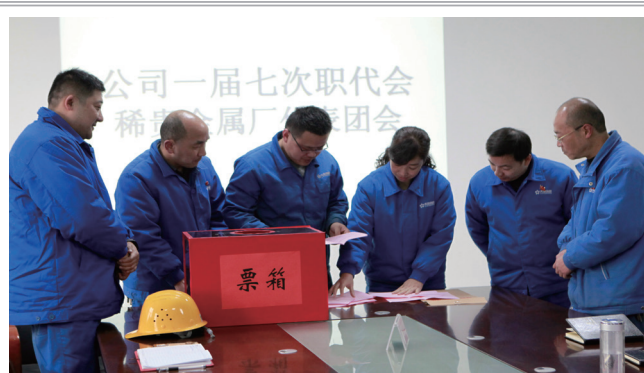
1月8日，厂组织职工代表对公司调资办法进行了学习讨论，以现场投票方式进行了表决。（青辰）

方案显示，“打非治违”由开发区整体安排并组织实施，内容为打击非法违法生产经营建设，治理纠正违规违章行为，活动时间为2017年12月至2018年12月。该厂在深入学习方案的基础上，对相关工作进行了部署，要求厂安全管理部门和各生产单位围绕区域内的违章行为展开深入纠察，切实解决影响和制约安全生产的突出问题，着力规范安全生产秩序，确保厂安全生产平稳运行。（青辰）