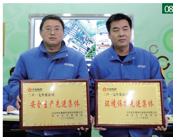
08.2017年度安全、环保先进集体