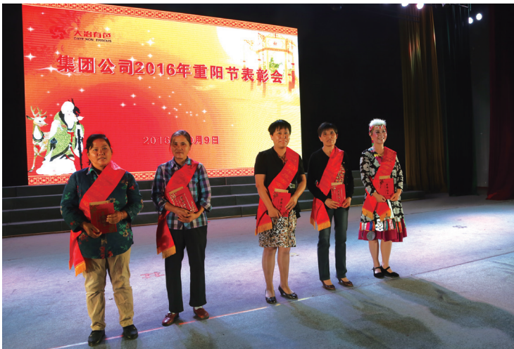
公司表彰的 2016 年度“孝亲敬老”先进个人。