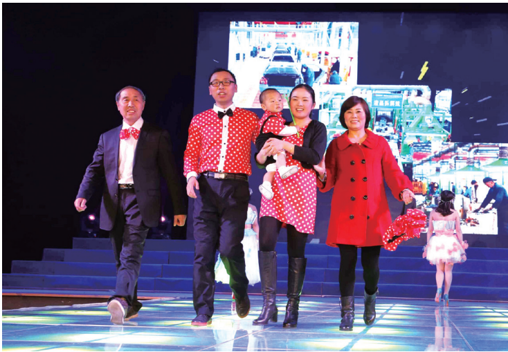
职工家庭成员时装秀。