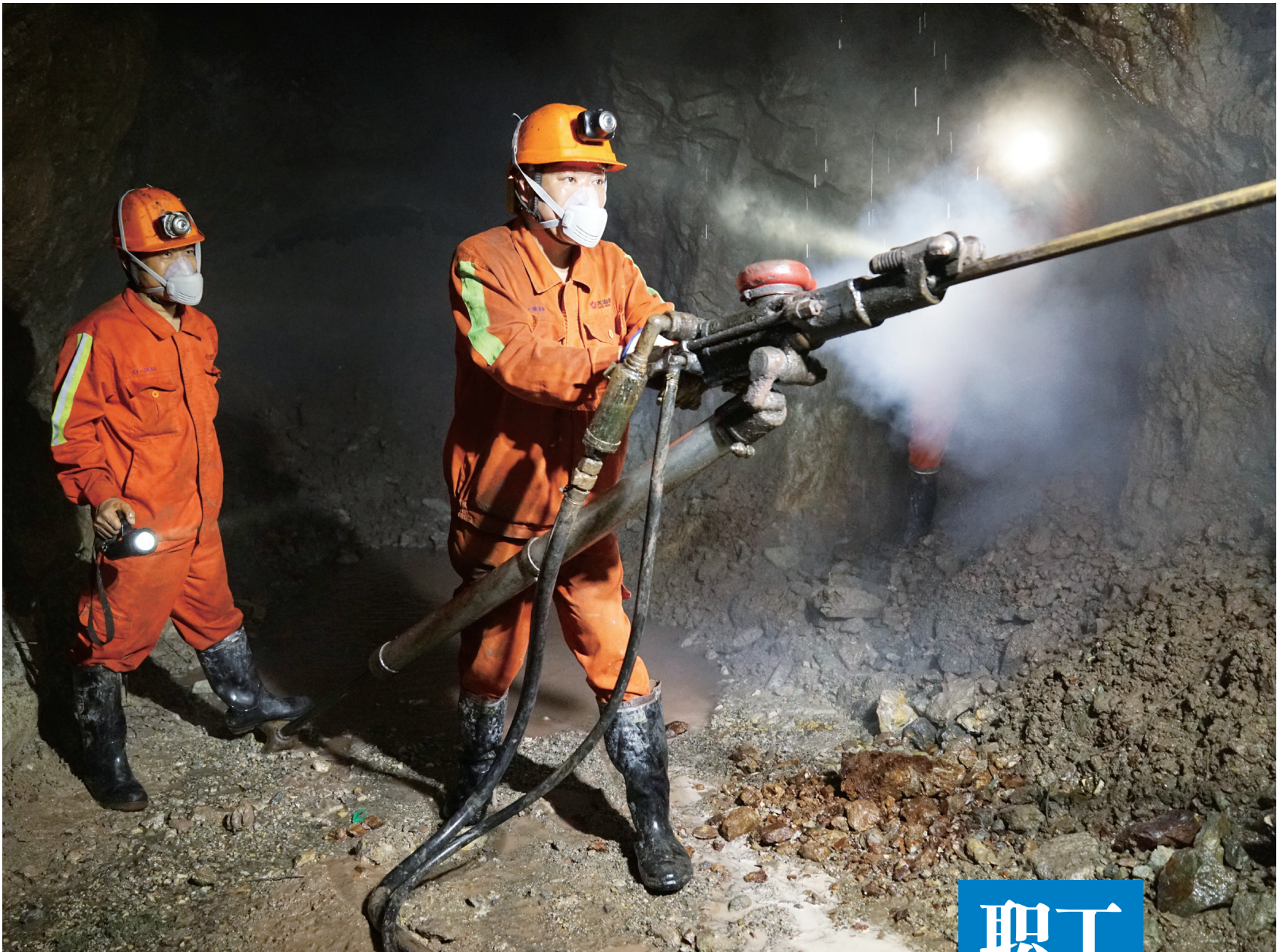
采矿尖兵 公司总部