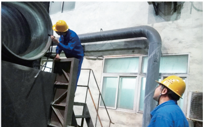
稀贵厂把问题解决在一线，措施落实在现场，力促管理提升。图为该厂负责人夜间带班检查回转窑运行情况。（焙烧宣）

会上，该车间负责人对车间一季度的成本和产品生产情况进行了分析。各班班长和粗炼班主操作手分别对各自负责区域的工作进行了总结。车间负责人还对职工最关心的薪酬问题进行了说明。与会职工表示，全员绩效考核在车间的深入推行，使全员工作积极性和主动性得到了提高，班组风气也产生了好的变化。（廖朝辉）