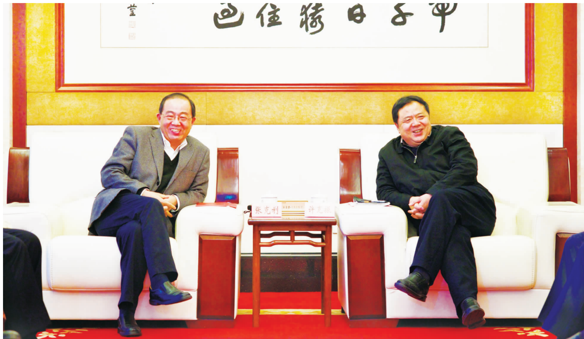
▲ 12 月 16 日，湖北省副省长许克振在省政府会议室会见中国有色集团党委书记张克利。邱杰 摄

本报讯 12 月 16 日，湖北省副省长许克振在省政府会议室会见中国有色集团党委书记张克利，双方就大冶有色发展及增资扩股等工作进行会谈。 张克利说，近些年来，在湖北省委省政府的正确领导和大力支持下，大冶有色集