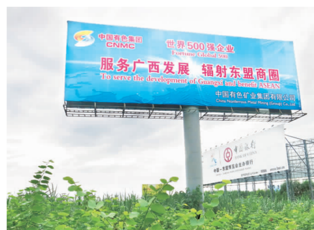
▲ 设置在南宁高速路口的巨幅户外T型牌。