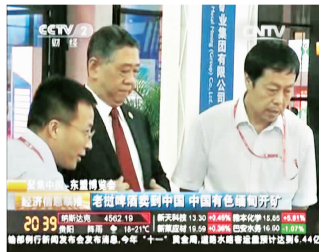
▲ 央视财经频道播出第十一届中国—东盟博览会中国有色集团展区盛况。