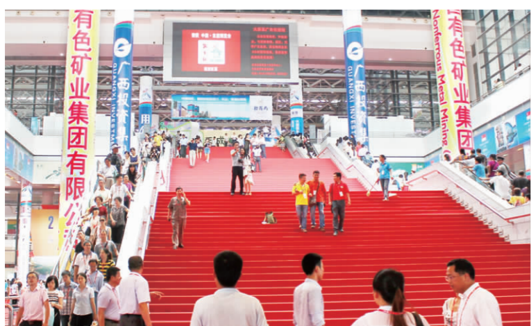
▲ 博览会主会场大厅立柱上的企业名称,展示着中国有色集团伸出热情的双臂,迎接四海宾朋。