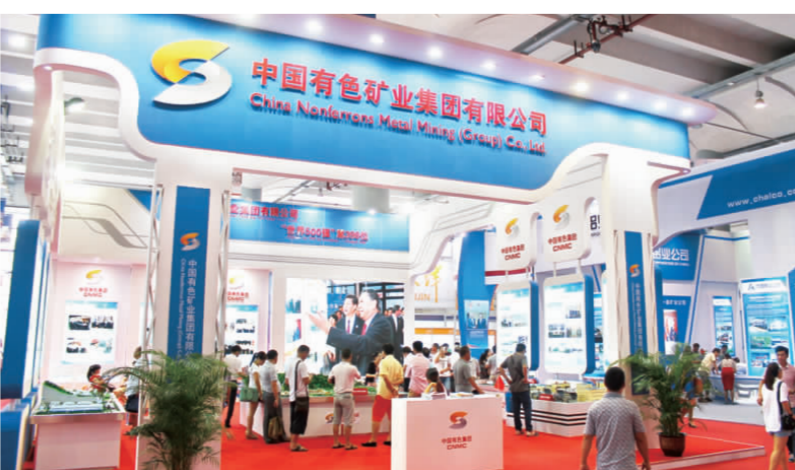
▲ 中国有色集团现场展台成为亮点。